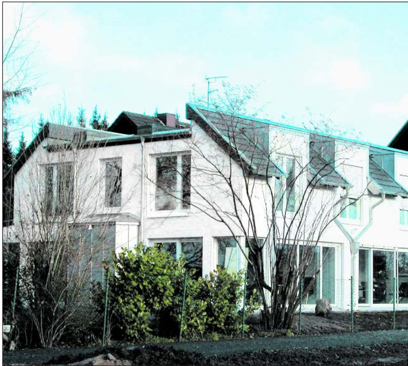
Erweiterung der Landesgeschäftsstelle der Lebenshilfe NRW in Hürth-Stotzheim

Bewerber können sich anmelden. Infos zu Fragen rund um das Fußballleistungszentrum und Bewerbungen gibt es unter Telefon (0 22 33) 9 32 45-32 oder unter E-Mail roh@lebenshilfe-nrw.de (vw)