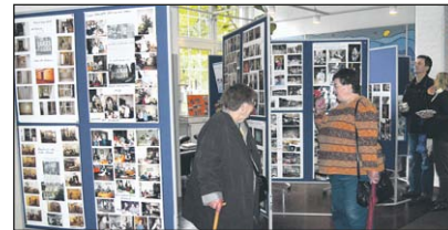
Bilder einer Ausstellung.