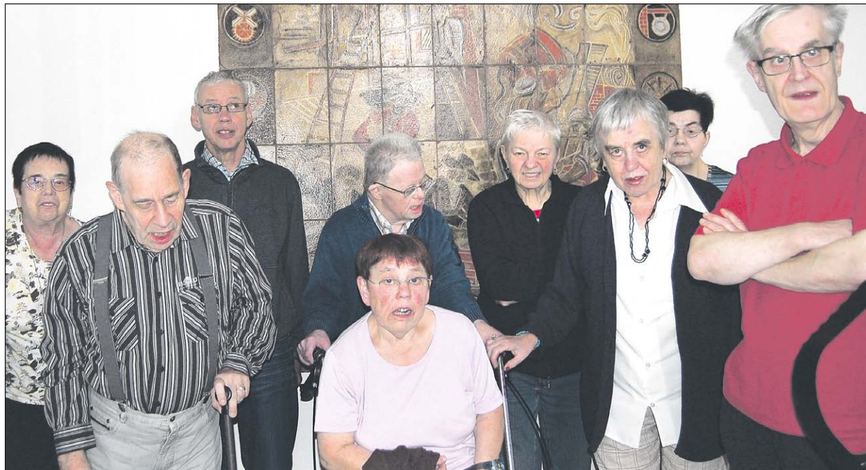
Das alte Mosaik, vor dem sich einige neue Bewohner versammelt haben, ist Bindeglied und Andenken an das Kolpinghaus.