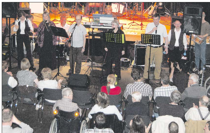
In der Klosterkirche feierten die Lennys mit Fans und musikalischen Gästen ihr 20. Bühnenjubiläum.