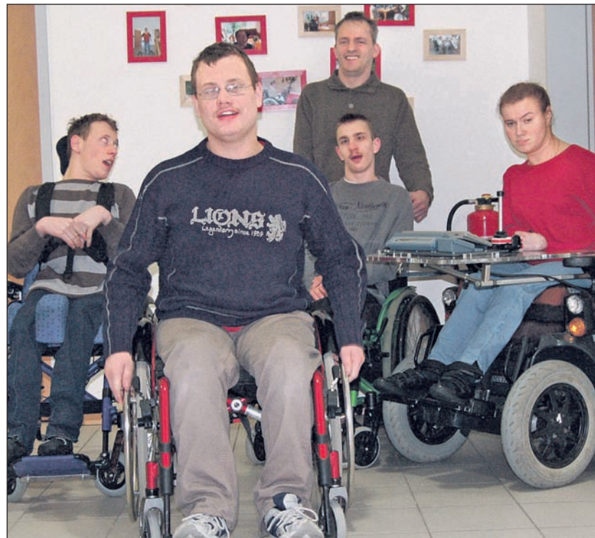
Viel Platz für Rollstuhlfahrer bietet der Anbau am Haus Reinwardtstraße.