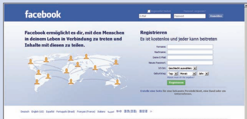
Screenshot Startseite Facebook

Die Vorzüge des sozialen Netzwerkes sind klar: Man bleibt mit seinen Freunden in Kontakt, präsentiert sich, eigene Fotos, Videos, Botschaften. Mitmachen kann jeder. Reinklicken, anmelden, los geht's. Das gesamte Angebot von Facebook mit allen Funktionen ist kostenlos. Infos unter www.facebook.com