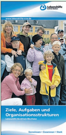
Ziele, Aufgaben und Organisationsstrukturen Lebenshilfe Nordrhein-Westfalen Gemeinsam - Zusammen - Stark

frage kommt, finden Sie im Internet in der Suchfunktion auf www.lebenshilfe-nrw.de unter dem Punkt Dienstleistungen und Einrichtungen. Oder rufen Sie uns an (Kontakt siehe Impressum auf der Titelseite).