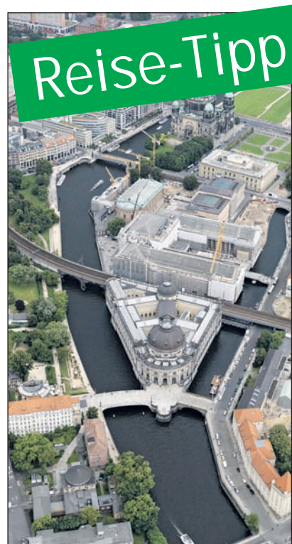
Alles im Blick: Die Museumsinsel aus der Vogelperspektive.