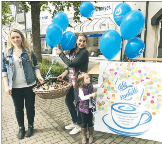
Viel Austausch und kreatives Miteinander vor dem „Café Konfetti“ des Lebenshilfe Centers Olpe

Das diesjährige Motto des Aktionstages „Wir gestalten unsere Stadt“ wurde von Menschen mit