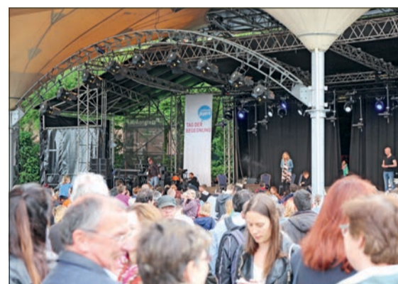
Tolle Auftritte auf der Tanzbrunnenbühne