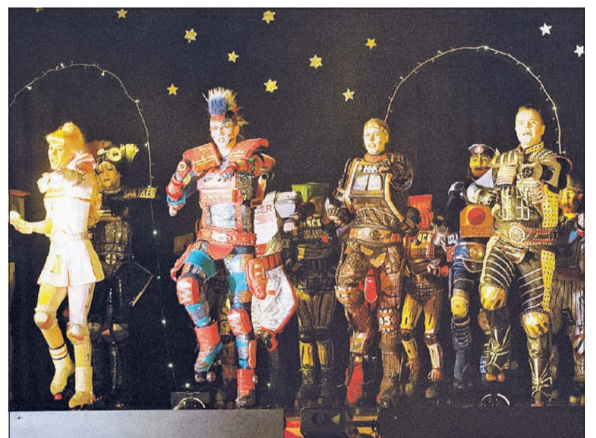
Sternenlicht-Revue: Hauptrollen des Musicals (von links): Pearl, Electra, Rusty und Greaseball

Seit 1996 führen die bis zu 35 Kinder und Jugendlichen im Alter von 5 bis 23 Jahren das Musical „Starlight Express“ für den guten Zweck auf. Unter dem Motto „Wir helfen Kindern in Not“ sind in dieser Zeit etwa 230 000 Euro eingespielt worden. Alles erreicht durch ehrenamtliches Engagement: Organisation, Technik, selbstgemachte Kostüme und nicht zuletzt die Schauspieler: „Da steckt eine Menge Arbeit drin. Aber alle Beteiligten, ob die Kinder und Jugendlichen auf der Bühne oder die Eltern und Freunde im Hintergrund, machen es mit viel Herz und Leidenschaft. Ein begeistertes Publikum und ein aus-