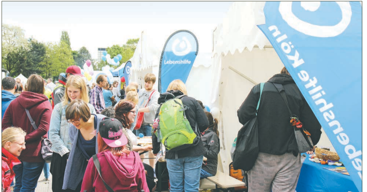
Die Lebenshilfe-Meile auf dem Tag der Begegnung war gut besucht.