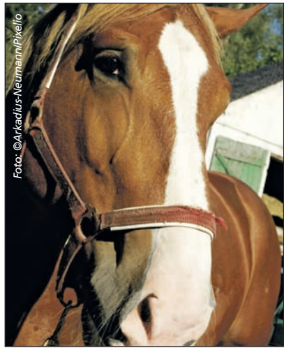
Hochwertige Sattelschränke für Pferde.