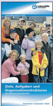
Ziele, Aufgaben und Organisationsstrukturen

Übernehmen Sie soziale Verantwortung. Unterstützen Sie die Ziele und Arbeit der örtlichen Orts- und Kreisvereinigungen der Lebenshilfe in NRW – werden Sie Mitglied. Bewegen Sie etwas durch Ihre Mitgliedschaft in der Lebenshilfe. Tragen Sie dazu bei, dass die Lebensqualität von Menschen mit Behinderung in der jeweiligen Region verbessert und ihre Teilhabe am gesellschaftlichen Miteinander gefördert wird.