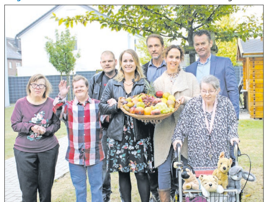
Gelungene Kooperation zwischen Fruchtimport Rosenland und der Lebenshilfe Mönchengladbach

bereits in der dritten Generation. Besonderen Wert wird auf die Qualität der Obst- und Gemüselieferungen gelegt, aber auch auf den persönlichen Kontakt zu Kunden und Lieferanten. Rosenland bezieht zwar auch frische Ware aus Süd- und Mitteleuropa, das Herzstück des Unternehmens liegt aber im Rheinland. Aus der guten Zu-