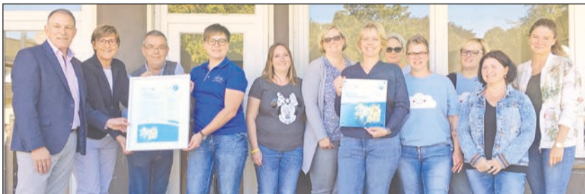
Offiziell zertifiziert zum Bewegungskindergarten

„Ziel ist, das Angebot über die Öffnungszeiten der Kita hinaus zu erweitern. Wir haben auch als Familienzentrum den Auftrag, zu schauen, was Kinder und Familien im Stadtteil benötigen. Wir vernetzen