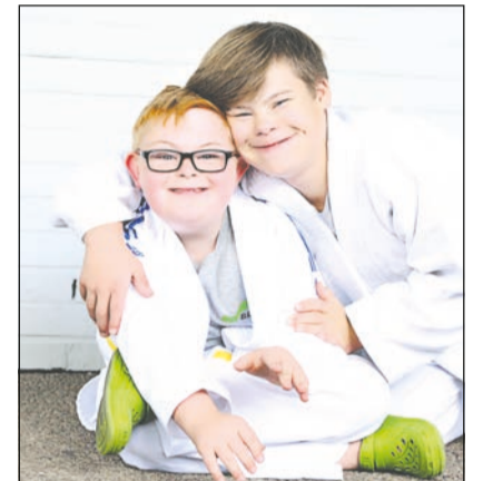
Bei Fotografin Jenny Klestil stehen die Menschen im Vordergrund und nicht das Handicap.

Menschen mit Down-Syndrom. Jenny Klestil: „Hierbei ist es mir wichtig zu zeigen, wie einfach der normale Umgang miteinander ist. Wie schön das Leben ist, wenn wir alle ein wenig von unserem Schubladendenken weg kommen.“ vvw