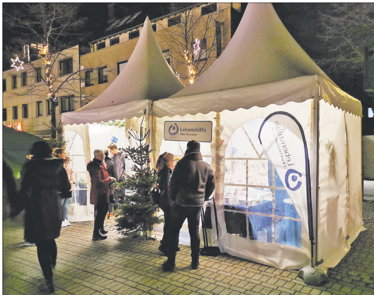
Festliche Stimmung vor Weihnachten