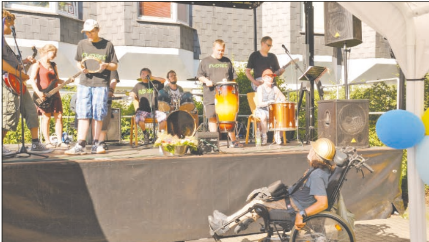
Inklusives Stadtteilstfest: Viele Besucher freuten sich über ein tolles Programm auf der Bühne.