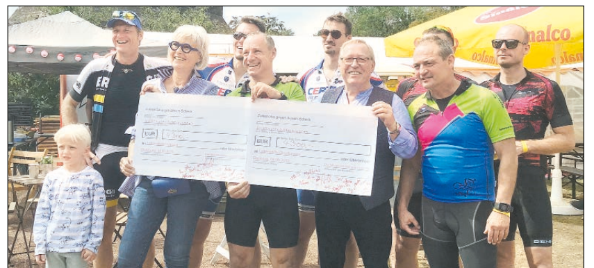
Zum vierten Mal: Zwei Spenden für zwei Lebenshilfen!