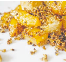
Auszüge des Rezepts in Leichter Sprache