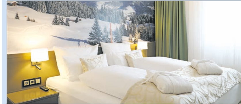
Das Alpenlodge Studio-Schlafzimmer

bend schönen und unberührten Landschaft im Herzen von Obersaxen. In den 20 gemütlich eingerichteten Zimmern, Suiten und Ferienwohnungen und im 1000 m² großen Spa- und Wellnessbereich kann man die Seele baumeln lassen und vom Alltag abschalten. Am Abend empfängt der Küchenchef des Hauses die Gäste mit seinem Team in der gemütlichen „Walserstube“. Die abwechslungsreiche Speisekarte bietet lokale sowie internationale Köstlichkeiten.