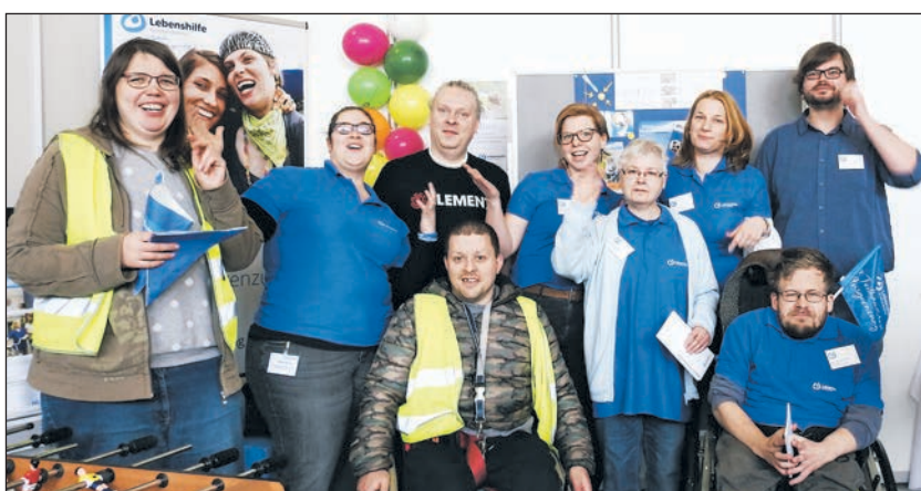
Das Team der Lebenshilfe NRW am Messestand in Minden.

„Wer sind wir? Bewohner, Nutzer, Freunde und Mitarbeiter der Le-