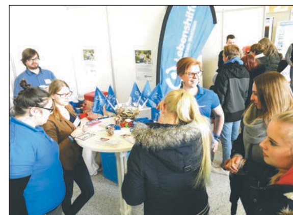
Zahlreiche Gespräche mit interessierten Jugendlichen und Eltern.