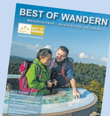
Druckfrisch erschienen, das neue Best-of-Wandern-Magazin, kostenlose Bestellung unter www.best-of-wandern.de