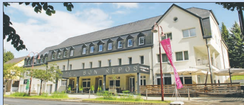
Hotel Le Bon Repos lädt zu einem Wochenende zu zweit ein.

untergebracht? Bitte mailen Sie die Lösung bis zum 3. August 2018 an gewinnspiel@lebenshilfe-nrw.de mit dem Stichwort «Gewinnspiel Region Müllerthal». ww