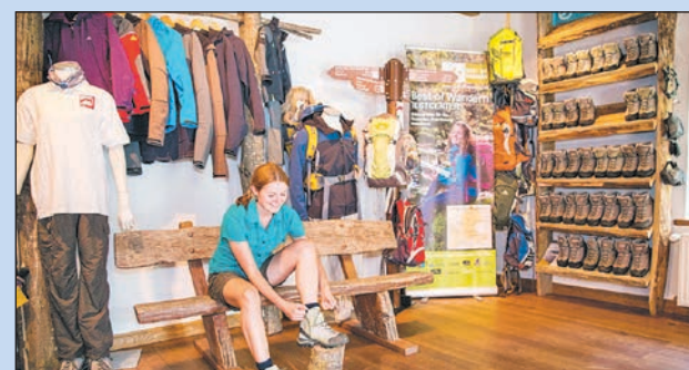
Wandern in der mystischen Felsenwelt Region Müllerthal (li.)/Testcenter in der Heringer Millen (re.)