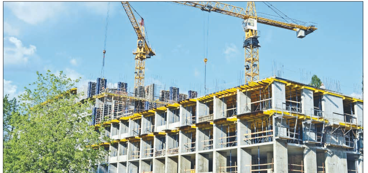
Der Bau öffentlicher Wohnungen wird von NRW-Landesregierung mit vier Milliarden Euro gefördert.

NRW-Landesregierung fördert Bau von öffentlichem Wohnraum