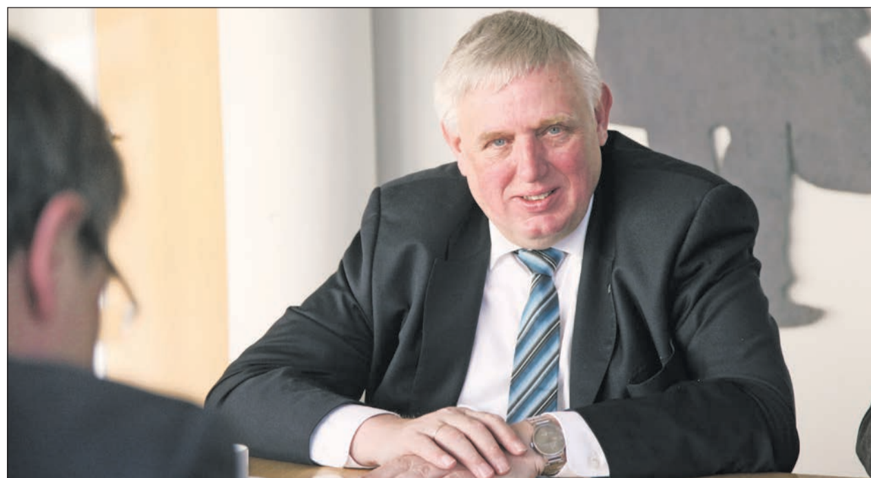
NRW-Landesminister Karl-Josef Laumann zur besseren Integration von Menschen mit Behinderung in die Gesellschaft

D rei Fragen – drei Antworten: Karl-Josef Laumann, Minister für Arbeit, Gesundheit und Soziales des Landes Nordrhein-Westfalen, stellte auf Anfrage des Lebenshilfe journals schriftlich dar, wie Menschen mit Behinderung noch besser in die Gesellschaft integriert werden können.