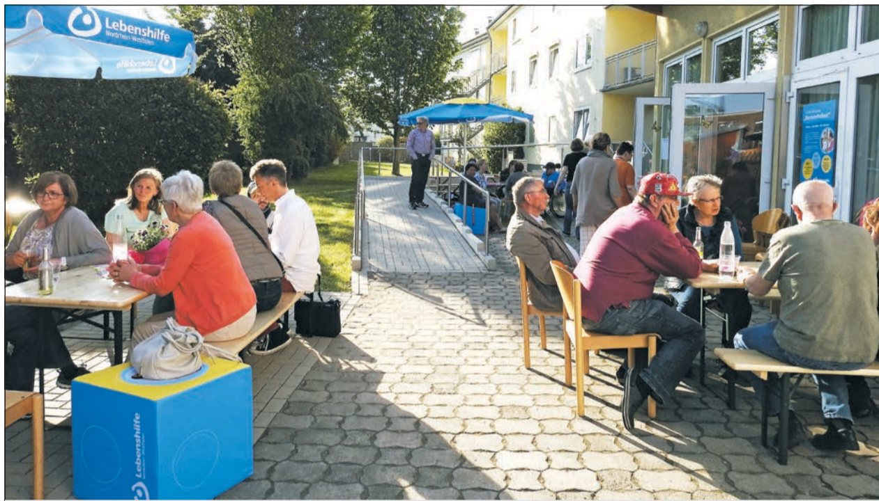
Interessante Begegnungen und Diskussionen