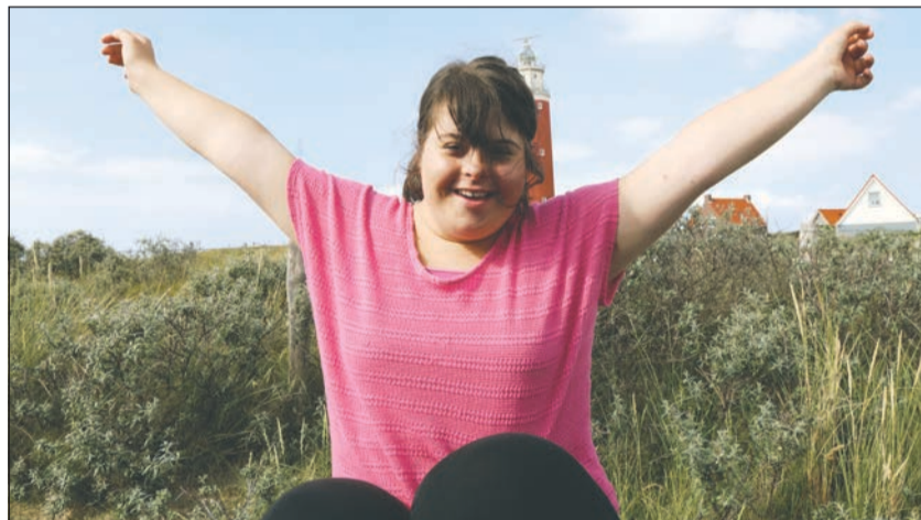
Pure Lebensfreude auf Texel