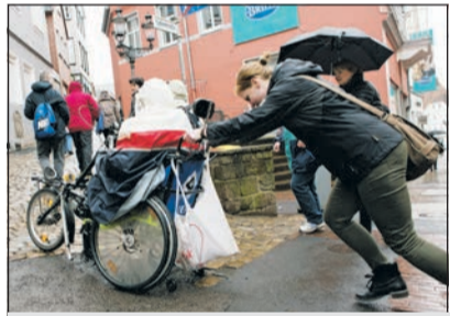
Barrierefreiheit im Praxistest

Am ersten Aktionstag wurde für Menschen mit und ohne Behinderung eine Stadtführung durch die Stadt Minden in leichter Sprache angeboten. Jeder Interessierte war herzlich willkommen. Die Teilnehmer des Stadtrundgangs haben