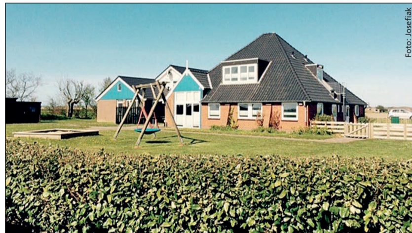
Das schön gelegene Ferienhaus für Selbstversorger der Lebenshilfe

T exel ist mit seinen 463,3 Quadratkilometern eine kleine traumhafte Nordseeinsel in Nordholland. Auch wenn die Tage kürzer und kühler werden, ist Texel eine Reise wert. Man kann die Insel mit dem Auto, dem Fahrrad