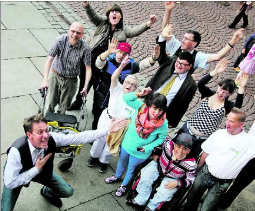
Sorgt für gute Stimmung: der Chor der Lebenshilfe Wuppertal.

Engagiert und mit Leidenschaft, so kann man Chor-Leiter Darko Slekovec bei Auftritten und den Proben erle-