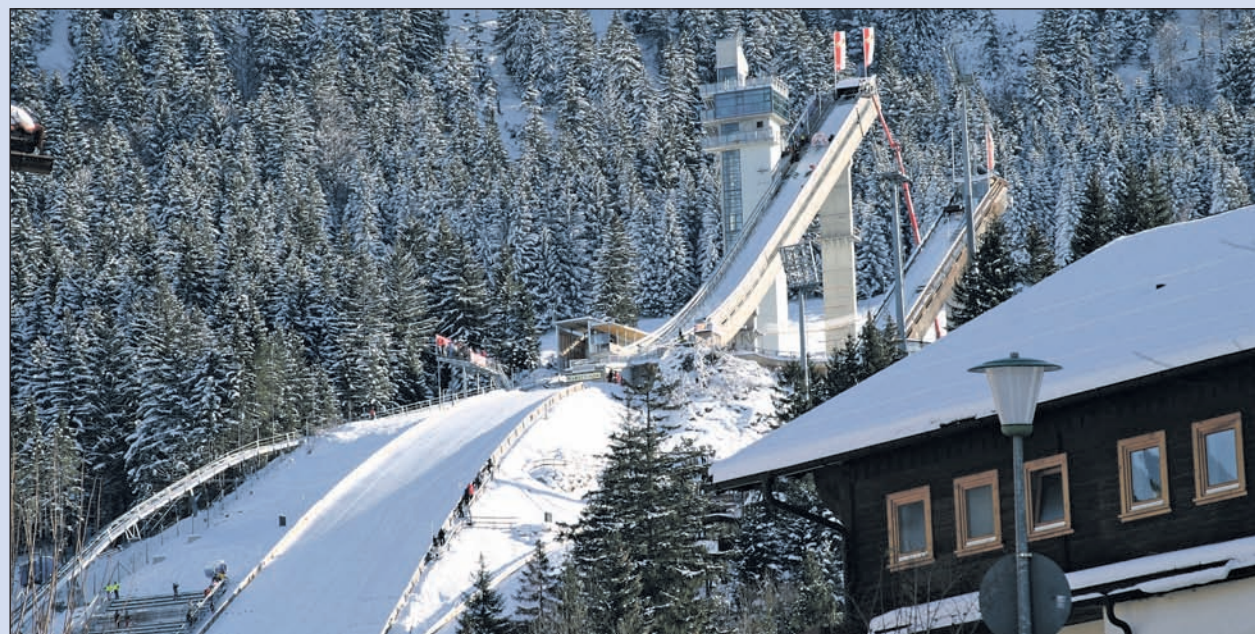
Die Sprungschanze in Oberstdorf.

Der Oberstdorfer Talkessel ist von einem Kranz hoher Berge umgeben, die alle zu den Allgäuer Alpen gehören. Diese hochalpine Gebirgskette mit Höhen über 2500 m bildet eine natürliche Grenze zum Nachbar Österreich.