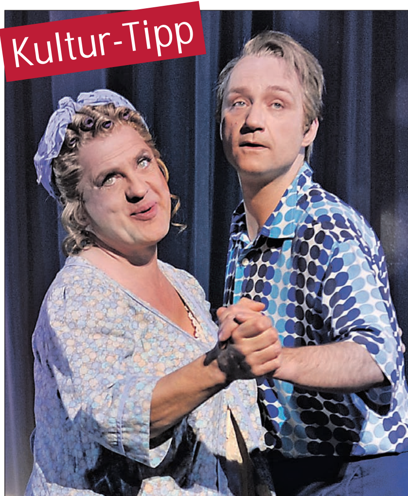
Edna Turnblad (Uwe Ochsenknecht) und Wilbur Turnblad (Leon van Leeuwenberg)