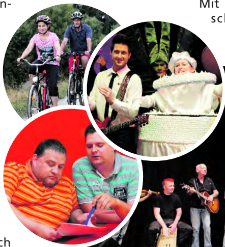
Die Lebenshilfe lebt Inklusion.

Eine weitere Änderung in der Satzung betrifft die Etablierung eines Lebenshilferates. Die Lebenshilfe Lübecke möchte durch die Bildung eines Lebenshilferates Menschen mit einer Behinderung einen garantierten Rahmen zur Mitwirkung und zur Vertretung ihrer Interessen im Verein bieten. Der Lebenshilferat soll Ansprechpartner und eigene Interessenvertretung sein für Menschen mit einer Behinderung in den Einrichtungen und Diensten der Lebenshilfe Lübecke. Die Lebenshilfe gibt damit Menschen mit Behinderung aus ihren Einrichtungen eine eigene Vertretungs- und Beratungsmöglichkeit innerhalb des Vereins.