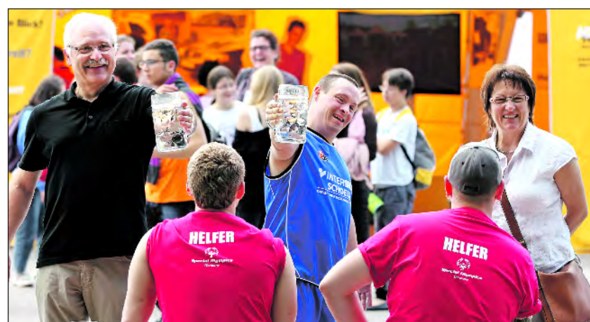
Helfer im Einsatz bei den Special Olympics 2012 in München

Inhaber Utto Reugels, der das Unternehmen 1978 gegründet hat: „Menschen mit Behinderung werden in verschiedenen Bereichen eingesetzt und können so ihre Fähigkeiten auf dem ersten Arbeitsmarkt entfalten.“ vw