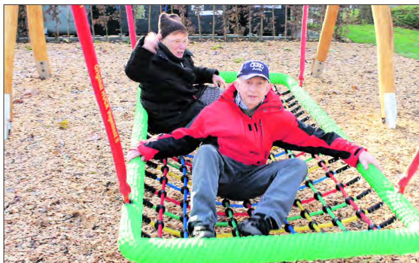
Für die Freizeitgestaltung gehört an den Wohneinrichtungen eine angepasste Ausstattung.