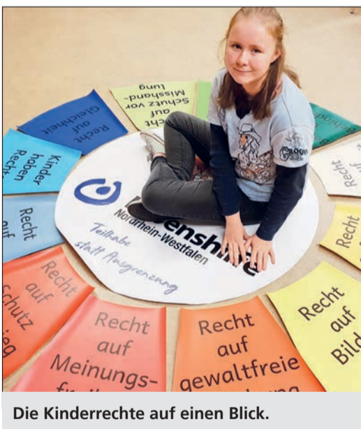
Die Kinderrechte auf einen Blick.

Beim Kinderrechte-Memory erhielt jedes Kind ein selbst gestaltetes Memoryspiel mit den Motiven zu den Kinderrechten, die in der Gruppe besprochen und diskutiert wurden. Anschließend hatten die Kinder die Möglichkeit in der Gruppe Memory zu spielen und durften das Spiel behalten, um sich auch nach dem Aktionstag weiter mit den eigenen Rechten zu beschäftigen. Bei der Kinderrechte-Rallye machten sich die Kinder auf die Suche nach den Rechten. Diese waren an