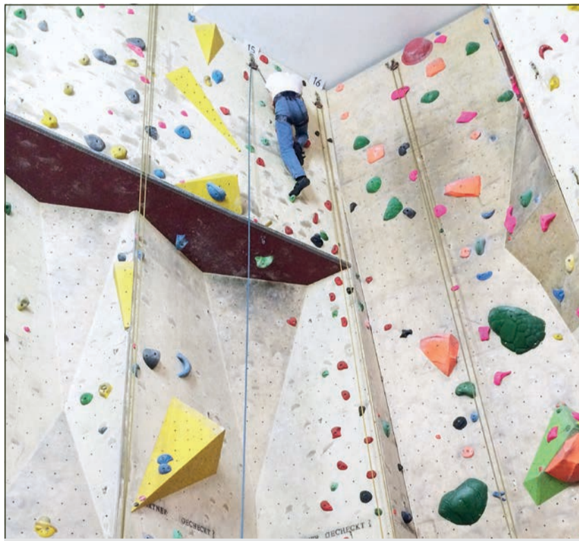
Ganz oben angekommen: Stefan Knuppertz.

Für die Teilnehmer stehen allerdings weniger die wissenschaftlichen