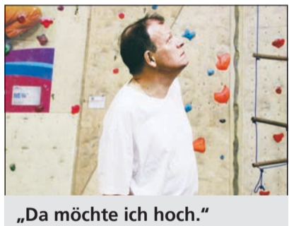
„Da möchte ich hoch.“

Die Varius-Mitarbeiter fahren einmal wöchentlich in die Kletterkirche Mönchengladbach und lernen dort