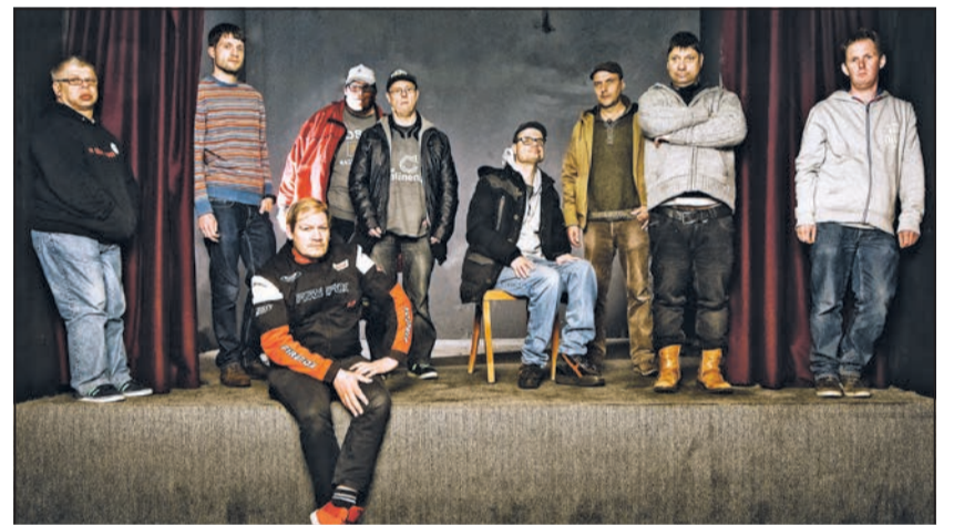
Die „Rockers“ sind eine der erfolgreichsten inklusiven Rockbands Deutschlands.