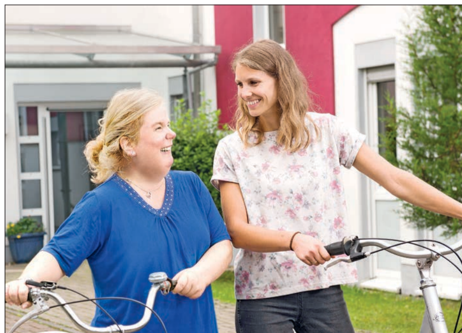
Gemeinsam und füreinander im Einsatz im Rahmen des FSJ-Tandems.

„Wenn die Stärken junger Menschen im sozialen Bereich liegen