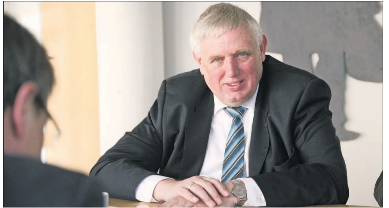
NRW-Landesminister Karl-Josef Laumann zur besseren Integration von Menschen mit Behinderung in die Gesellschaft

D rei Fragen – drei Antworten: Karl-Josef Laumann, Minister für Arbeit, Gesundheit und Soziales des Landes Nordrhein-Westfalen, stellte auf Anfrage des Lebenshilfe journals schriftlich dar, wie Menschen mit Behinderung noch besser in die Gesellschaft integriert werden können.