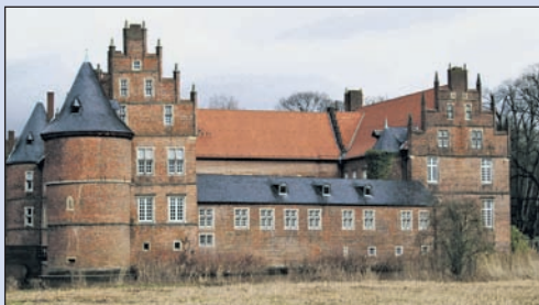
Das Hertener Wasserschloss, hier und im Schlosspark wird der Kunstmarkt stattfinden.

Auch dieses Jahr werden die Pforten des Kunstmarkts von 11 bis 19 Uhr für Kunst- und Kulturinter-