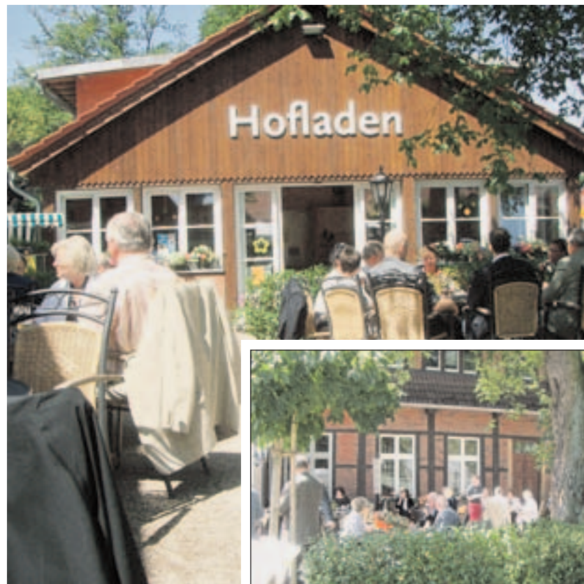
Kaffee und Kuchen im historischen Gutshaus „Café Gut Kinderhaus“.