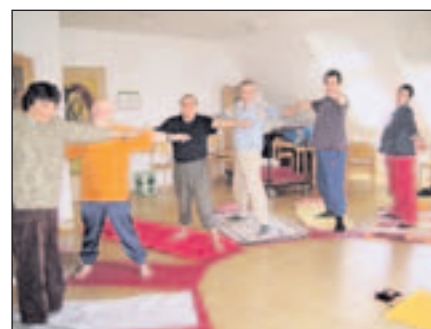
Konzentriert sind die Teilnehmer der Yoga-Gruppe bei der Lebenshilfe Aachen.

zu anderen Gruppen liegen in der Form des Unterrichts. So führt Dorothea Horbach die Übungen sehr langsam und weniger komplex aus, erklärt bildhaft, wiederholt einzelne Abschnitte öfter und motiviert die Teilnehmer anders: „Ich leite manche Haltungen anders an, damit mich die Teilnehmer verstehen. Ich mache die Übungen selbst vor und übe anschließend mit. Durch das Visuelle lernen sie und nehmen die einzelnen Haltungen auf. Toll ist, dass sie keine Scheu haben zu singen, denn über das Singen wird die Konzentration gefördert und der