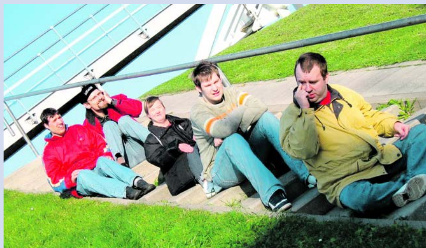
Bewohner der Wohnstätte Herten auf Freizeit im Norden.

Haben Sie Interesse an der schönsten Zeit des Jahres unserer Klienten aktiv teilzuhaben? Es erwartet Sie eine abwechslungsreiche und verantwortungsvolle Aufgabe. Im Rahmen einer Übungsleiterpauschale erhalten Sie eine