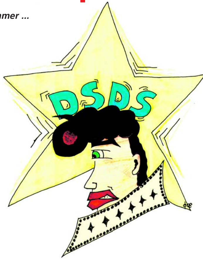
Karikatur eines „Deutschland sucht den Superstar Teilnehmers“ Elvis-Karikatur von C. Köster 2008.

An dieser Stelle, ein passender Buchtip: „Generation Doof“ von Anne Weiss und Stefan Bonner, erschienen in der Lübbe-Verlagsgruppe.