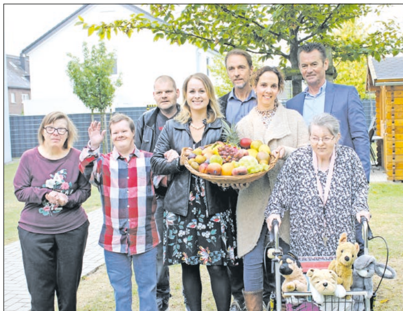
Gelungene Kooperation zwischen Fruchtimport Rosenland und der Lebenshilfe Mönchengladbach

bereits in der dritten Generation. Besonderen Wert wird auf die Qualität der Obst- und Gemüselieferungen gelegt, aber auch auf den persönlichen Kontakt zu Kunden und Lieferanten. Rosenland bezieht zwar auch frische Ware aus Süd- und Mitteleuropa, das Herzstück des Unternehmens liegt aber im Rheinland. Aus der guten Zu-