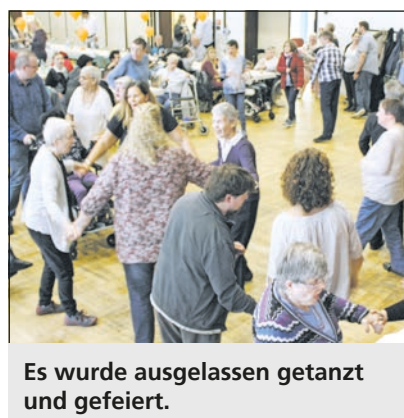
Es wurde ausgelassen getanzt und gefeiert.

Begrüßungen der neuen Bewohner/-innen, die Ehrungen langjähriger Bewohner/-innen und die Dienstjubiläen unserer Mitarbeiter/-innen.