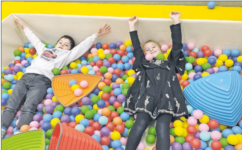
Bewegung und Spaß für Kinder

Kindertageseinrichtung Familienzentrum Schatzkiste wurde zum Bewegungskindergarten zertifiziert