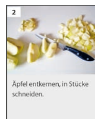
2 Äpfel entkernen, in Stücke schneiden.