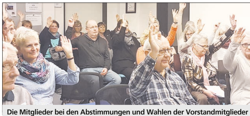
Die Mitglieder bei den Abstimmungen und Wahlen der Vorstandmitglieder