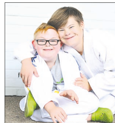
Bei Fotografin Jenny Klestil stehen die Menschen im Vordergrund und nicht das Handicap.

Menschen mit Down-Syndrom. Jenny Klestil: „Hierbei ist es mir wichtig zu zeigen, wie einfach der normale Umgang miteinander ist. Wie schön das Leben ist, wenn wir alle ein wenig von unserem Schubladendenken weg kommen.“ vw