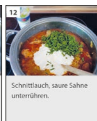
12 Schnittlauch, saure Sahne unterrühren.