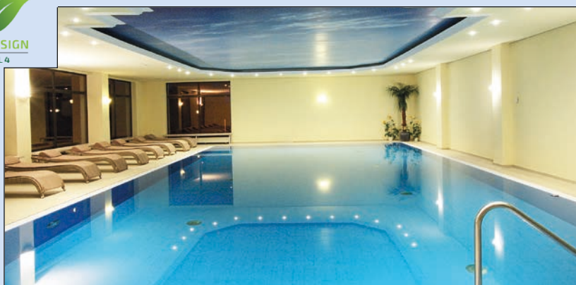
Großes, modernes Hotelhallenbad