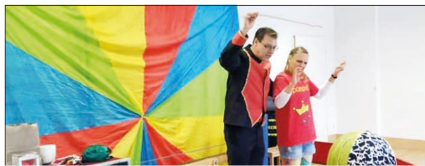
Sorgten für Faszination: die Künstler des Zirkus Pompitz

war es, die Kinder in die Welt des Zirkus eintauchen zu lassen. Das Lernen mit Kopf und Körper wurde angeregt, die Kinder haben soziale, kognitive, motorische, emotionale und gestalterische Förderung erfahren. Die angebotenen Zirkusdisziplinen Artistik, Akrobatik, Jonglage, Fakir-techniken und Tigerlöwen boten für jedes Kind etwas, das herausfordernd war und Chance zur Entfaltung bot. In einer großen Abschlussvorführung wurde das Event in einem Zirkuszelt mit allen Familien, Freunden und Verwandten gefeiert.