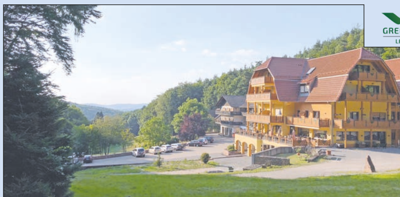
Drei Sterne Wald Hotel Heppe in wunderschöner Waldlage