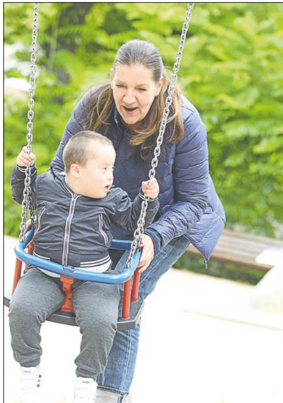
Schauspielerin Katy Karrenbauer

Jenny Klestil präsentiert einzigartige Bildersammlung über Menschen mit Handicap im großen Stil