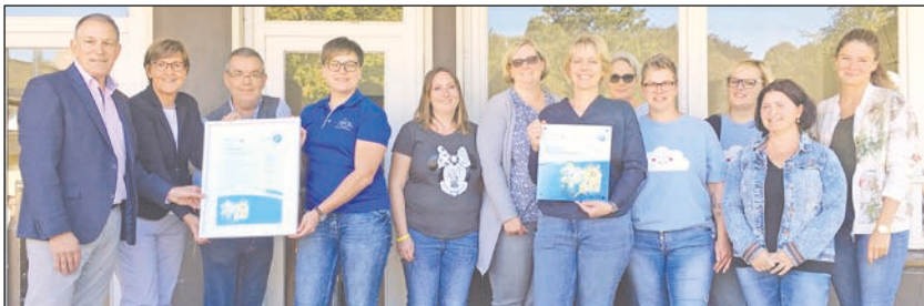
Offiziell zertifiziert zum Bewegungskindergarten

„Ziel ist, das Angebot über die Öffnungszeiten der Kita hinaus zu erweitern. Wir haben auch als Familienzentrum den Auftrag, zu schauen, was Kinder und Familien im Stadtteil benötigen. Wir vernetzen