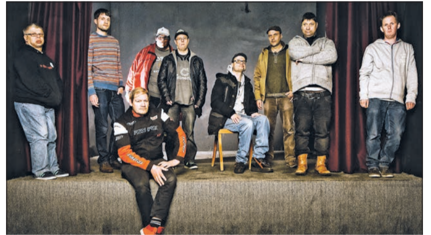
Die „Rockers“ sind eine der erfolgreichsten inklusiven Rockbands Deutschlands.