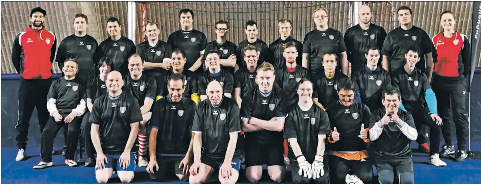
Die Sportler mit ihren Trainern und Betreuern

Fußballfabrik Ingo Anderbrügge unterstützt aktive Sportler der Lebenshilfe Herne und der wewole Herne