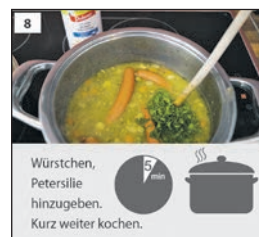
Auszüge des Rezepts in Leichter Sprache