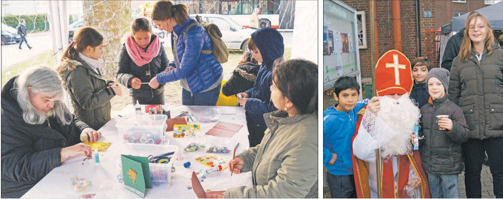
Beliebte Aktion: Basteln von Weihnachtskarten mit verschiedenen Motiven (links)/Der Nikolaus in Mitte seiner Fans (rechts).

200 Besucher erlebten die besondere weihnachtliche Stimmung vor der Lutherkirche in Bulmke-Hüllen