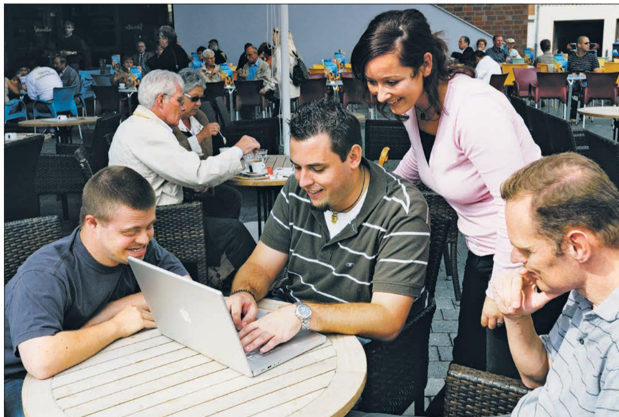
Im Team macht Fort- und Weiterbildung Spaß.

Das breite und vielfältige Angebot an Fort- und Weiterbildungsmöglichkeiten wird an unterschiedlichen Orten in NRW angeboten. Die Bedarfe und Interessen der