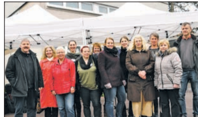
Zahlreiche Organisatoren des Festes auf einem Blick