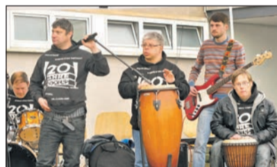
Die Rockers aus Waltrop begeisterten mit ihren selbstgeschriebenen Rockstücken die Massen.