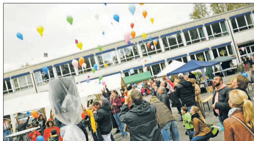
Ein Höhepunkt des Tages war die Luftballonaktion zum Ausklang des Festes.