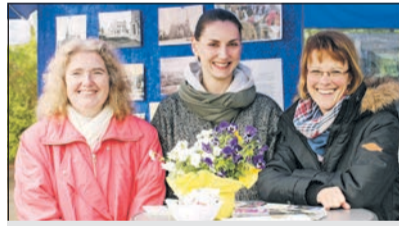
Die Damen des Generationsnetzes Gelsenkirchen e. V. informierten über ihre Arbeit.