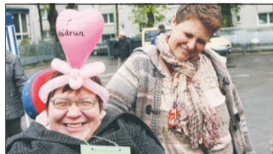
Die Besucher des Festes hatten großen Spaß am gemeinsamen Feiern.