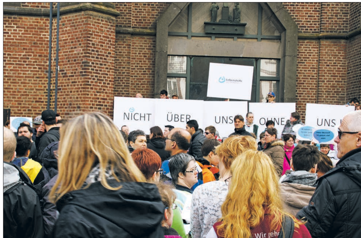
Demo der Lebenshilfe Rhein-Kreis Neuss auf dem Grevembroicher Marktplatz

Demo der Lebenshilfe Rhein-Kreis Neuss e.V. und anderer Lebenshilfen