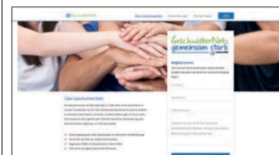
So sieht die Startseite des GeschwisterNetzes aus.

S ie sind unter besonderen Bedingungen groß geworden und fühlen sich als Erwachsene oft für ihren Bruder oder ihre Schwester verantwortlich: erwachsene Geschwister von Menschen mit Behinderung. GeschwisterNetz ist ein neues Online-Angebot der Bundesvereinigung Lebenshilfe. Es soll erwachsene Geschwister von Menschen mit Behinderung verbinden, unterstützen und stärken.