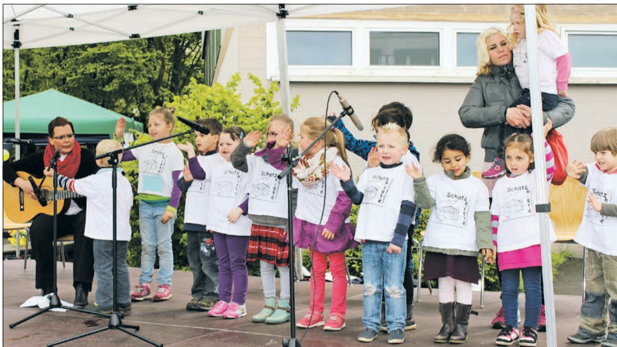
Der Kinderchor der Schatzkiste interpretierte Kinderlieder auf seine ganz eigene Weise.

An diesem Tag war das einzig Graue das Wetter, das über den Teilnehmern wachte. Die Aktionen haben den Tag bunt gestaltet: bei einem Rollstuhlparcours und einem Parcours, bei dem Sehbehinderun-