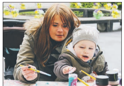
Spiel- und Bastelspaß gab es für Groß und Klein.

Das gemeinsame Steigenlassen vieler bunter Luftballons hat den Sinn der Gemeinschaft unterstrichen und soll der Startschuss für viele weitere gemeinsame Feste und Aktionen im Quartier sein. Nückel