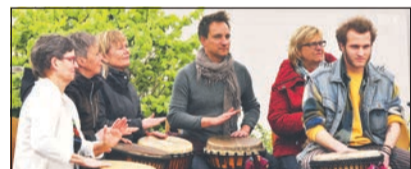
Mit der Percussion-Gruppe „Come with us“ startete das abwechslungsreiche Programm.