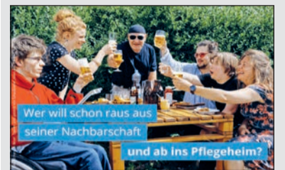
Wer will schon raus aus seiner Nachbarschaft und ab ins Pflegeheim?

Verlust des Zuhauses? Neue Kampagne der Lebenshilfe soll auf kritische Punkte des Bundesteilhabegesetzes aufmerksam machen