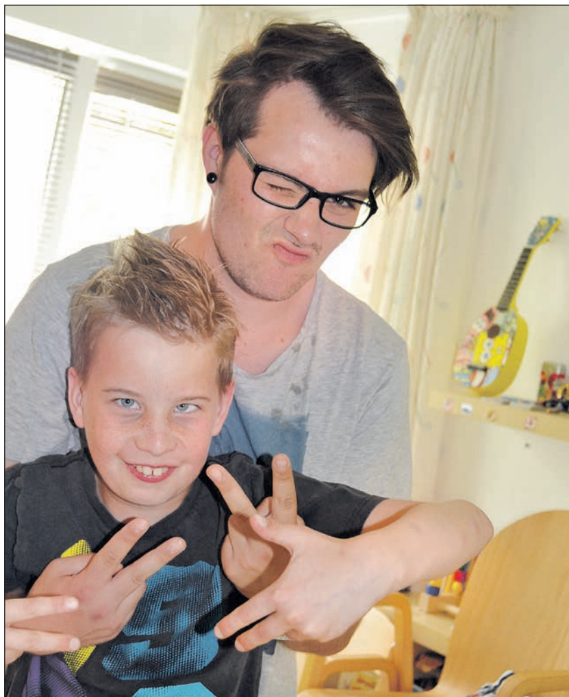
Zwei, die sich verstehen

„Es ist immer wieder toll praktische Einsatzstelle zu sein. Zum einen für junge Menschen, die eine Ausbildung zum Sozialhelfer, Altenpflegehelfer, Heilerziehungspfleger und examinierten Altenpfleger machen wollen, aber auch Menschen mit Berufserfahrung in anderen