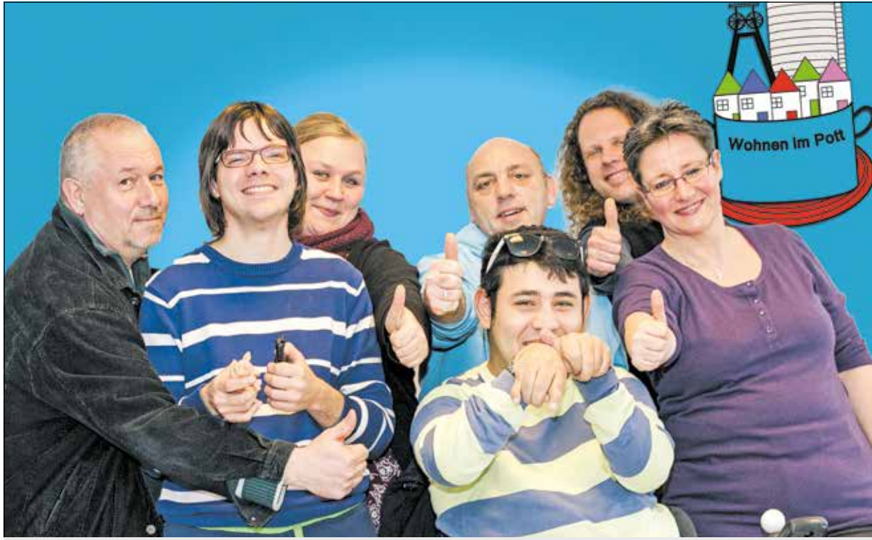
Das Team von „Wohnen im Pott“ kümmert sich unter anderem um die Wohnungsvermittlung von Menschen mit Behinderung in Oberhausen.

Projekt der Lebenshilfe Oberhausen berät Menschen mit Behinderung bei der Wohnungssuche / Auszeichnung mit Inklusionspreis NRW