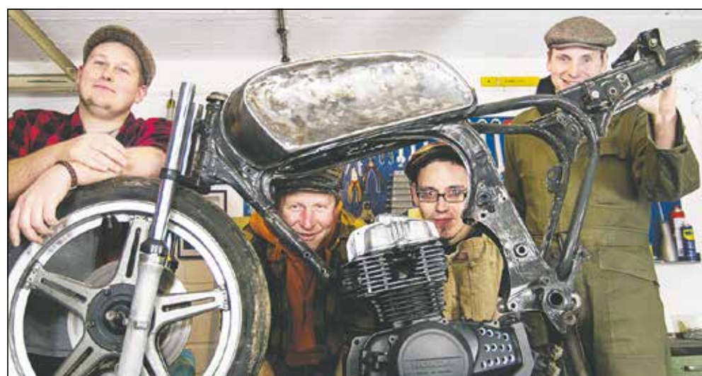
Die „Schrauber“ mit ihrem „Objekt der Begierde“, eine Honda CB 400, Baujahr 1980

wieder zusammengesetzt werden. Mehrere Stunden in der Woche können die technikbegeisterten Bewohner hier unter Anleitung schrauben, schweißen und fachsimpeln.