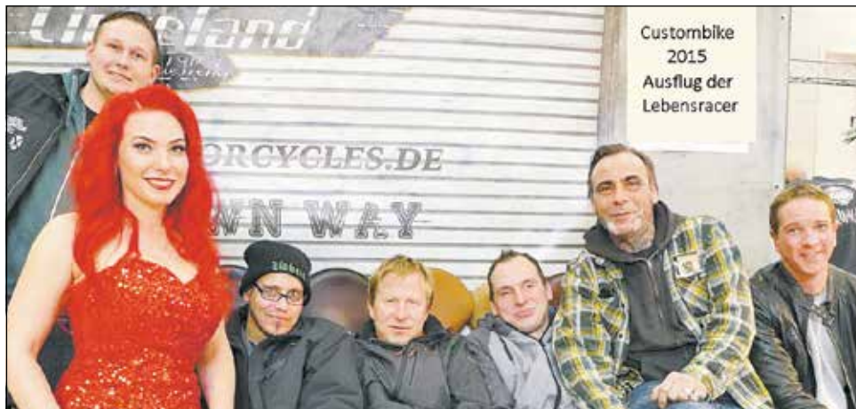
Ein erster Ausflug der Lebensracer – Wer hat sich den da in das Bild gedrängt?