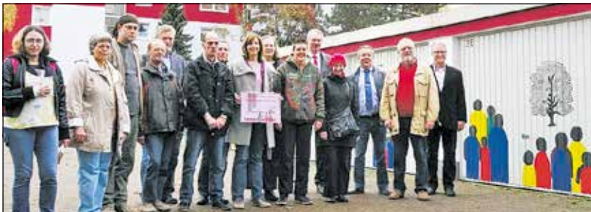
Künstler der Lebenshilfe, Mitarbeiter des Heimat- und Verkehrsvereins, der Interessengemeinschaft Schmachtendorf und der Immeo-Wohnen

Die Umrisse der Motive wurden mit dem Overheadprojektor und teilweise „frei Hand“ auf die Garagentore übertragen und anschließend mit Lackfarbe ausgefüllt. Auch bei diesem Projekt bekam das Team der Werkstatt am Kaisergarten sehr oft Lob von vorbeikommenden Passanten und Anwohnern; Kindern gefielen besonders die bunten Personen. Die Arbeiten