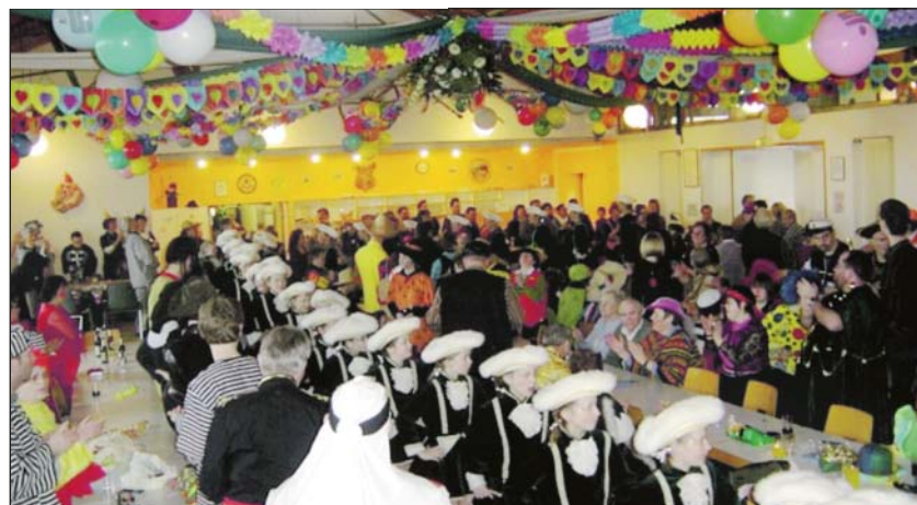
Einmarsch der Prinzensgarde in das Bürgerhaus von Weeze-Wemb.

Am Sonntag, dem 20. Februar 2011 um 12.11 Uhr geht's jeck los. Alle Freunde und Förderer, alle Jecken und Unjecken, alle Groß und Klein sind herzlich eingeladen.