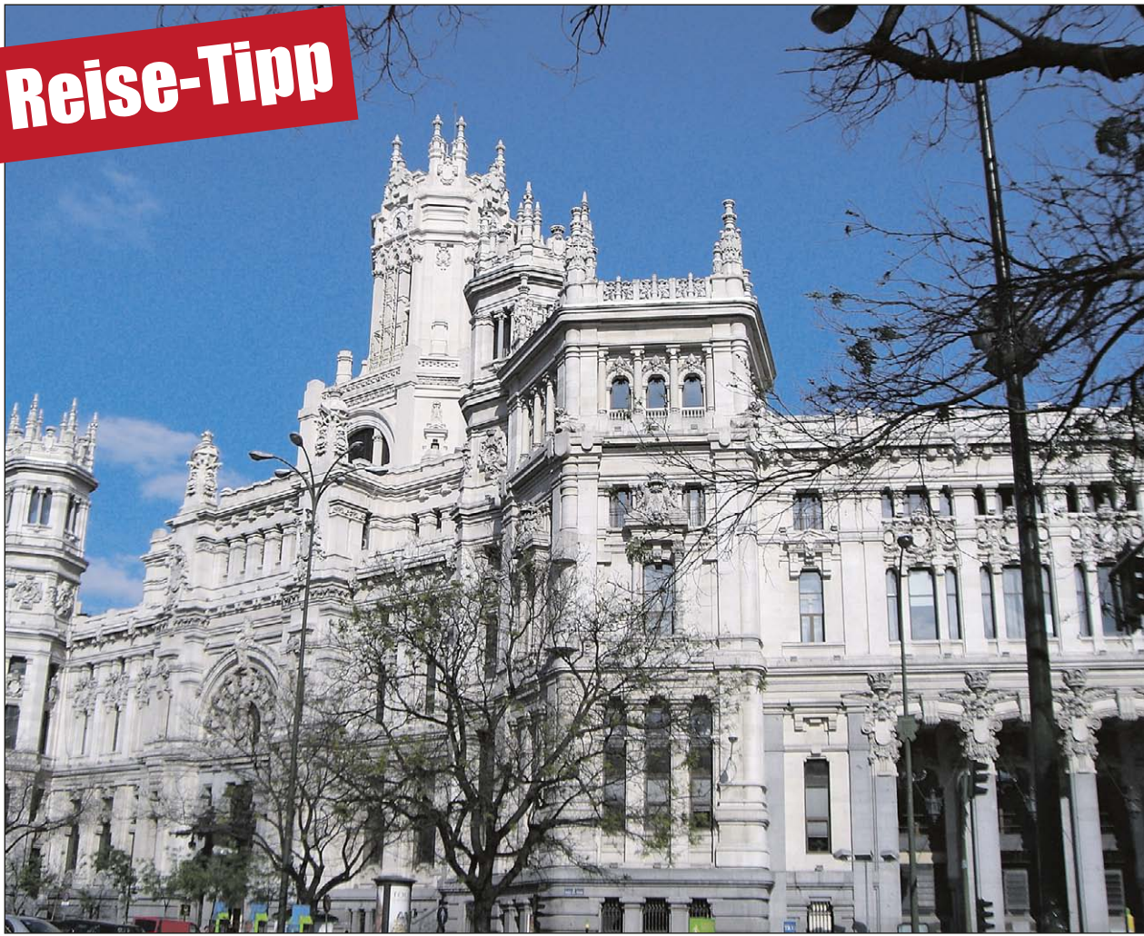
Auf nach Madrid zum Weltjugendtag 2011.