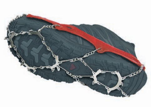
Spikes: Schneeketten am Schuh

del erhältlich. Erleben Sie die schöne Winternatur mit einem Paar Schneeschuhen im Wert von 189 Euro. Gewinnen Sie auch eine Stirnlampe (Wert: 40 Euro) und ein Paar Spikes (40 Euro), zur Sicherheit in der dunklen Jahreszeit, sowie einen Brunch-Gutschein für zwei Personen (Wert: 39 Euro) im Haus Hammerstein im Bergischen Land. Das Redaktionsteam freut sich auf Ihre Einsendungen. vw