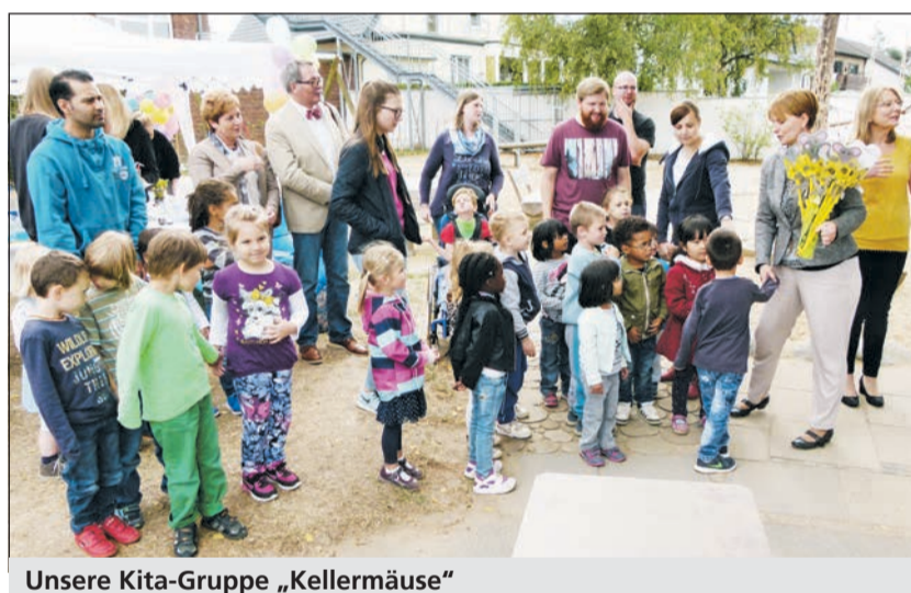
Unsere Kita-Gruppe „Kellermäuse“

betonte als betroffener Vater und als Vorsitzender des Elternbeirates die gute Betreuung gerade von Kindern mit Handicap. Gleichzeitig mit der Eröffnung der neuen Gruppe wurde auch das moder-