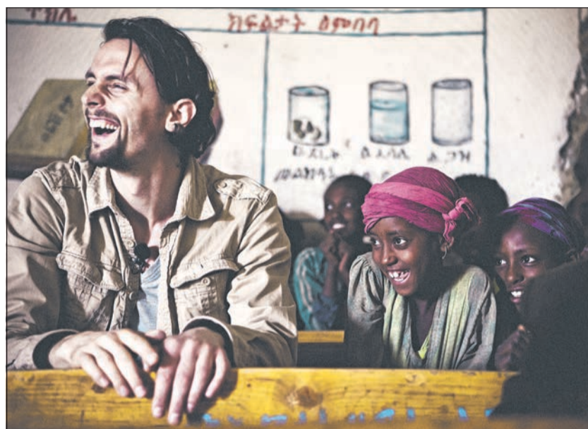
Neven Subotić engagiert sich mit seiner Stiftung in den ländlichen Regionen Äthiopiens, um die Rechte der Kinder zu sichern.

7. Mein Lebenswunsch/größter Lebensraum: Mein Lebensmotto lau-