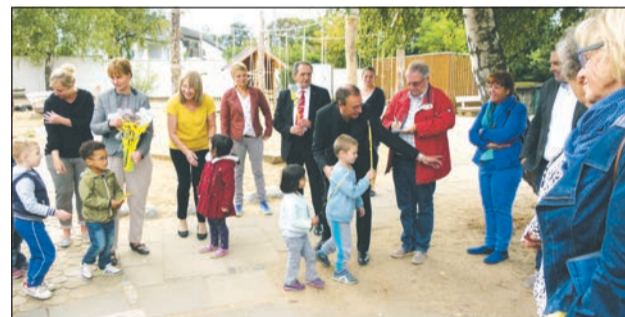
Die Kinder verteilen selbst gebastelte Gastgeschenke.

terdisziplinären Frühberatungs- und Frühförderstelle untergebracht, weil auch hier die Nachfrage stetig steigt.