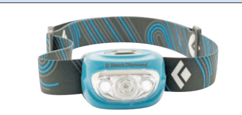
Die Stirnlampe für Einsätze im Dunkeln