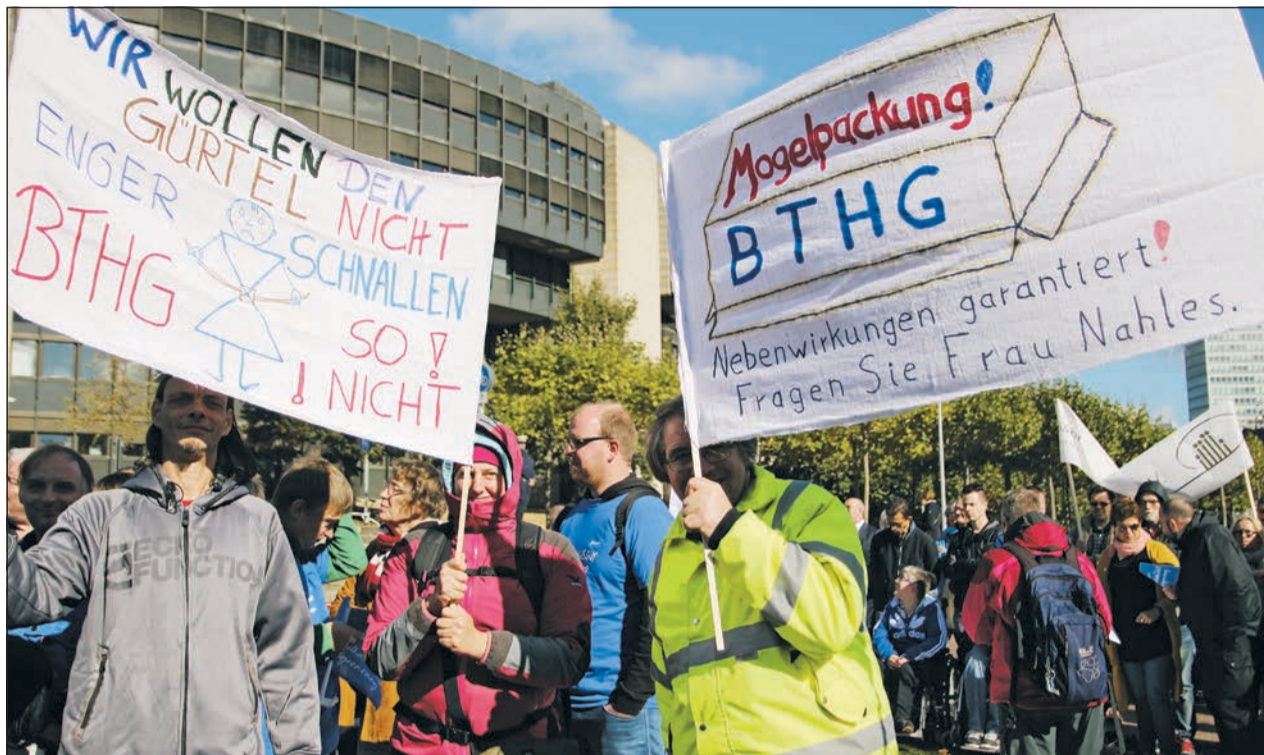
Mehr als 4000 Menschen mit und ohne Behinderung demonstrierten Anfang Oktober 2016 vor dem Landtag in Düsseldorf für ein besseres Bundesteilhabegesetz.

Erfolgreiche Kampagne zum Bundesteilhabegesetz: Forderungen der Lebenshilfe finden sich im Gesetz wieder