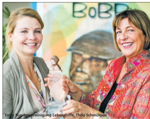
Ulla Schmidt überreichte Annette Frier den Bobby.

„Ich freue mich wahnsinnig“, sagte Frier, als sie den Bobby entgegen nahm. Ausgezeichnet wurde die Schauspielerin für die Rolle als werdende Mutter in der WDR-Produktion „Nur eine Handvoll Leben.“ Darin spielt sie „sehr authentisch“, wie es Lebenshilfe Bundesvorsitzende