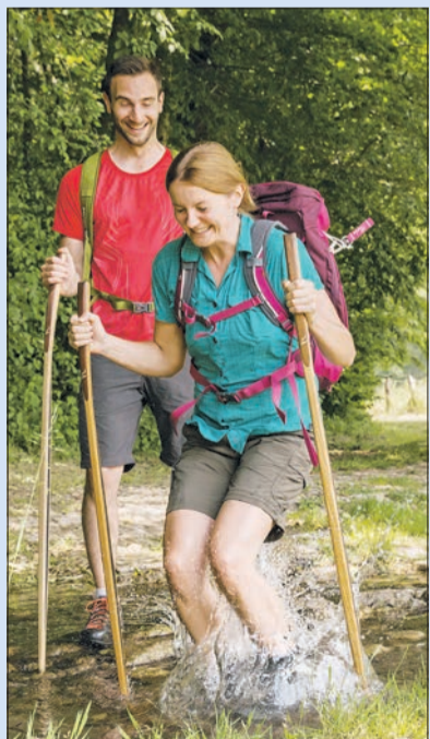
Der Wanderstab Gemse im Einsatz

Schicken Sie uns ein Foto oder eine kleine Geschichte von Ihrem schönsten Wintererlebnis per E-Mail an gewinnspiel@lebenshilfe-nrw.de oder per Post an Lebenshilfe NRW, Verena Weiße, Stichwort: Wintererlebnis, Abtstraße 21,