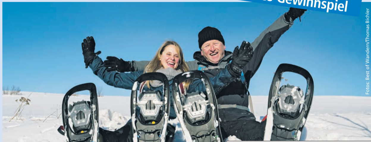
Winterspaß: Schneeschuhwandern im Frankenwald

50354 Hürth. Einsendeschluss ist der 24. März 2017. Die schönsten Fotos werden in der nächsten Ausgabe des Lebenshilfe Journals präsentiert und mit tollen Preisen ausgezeichnet.