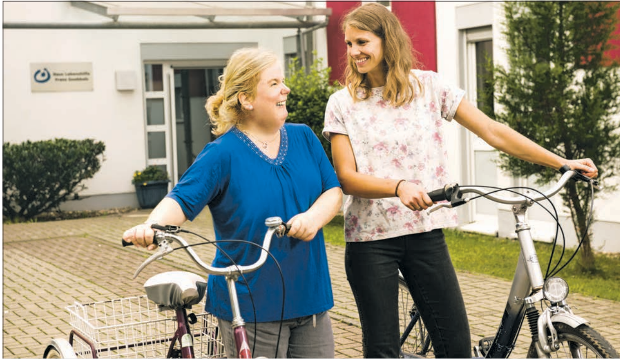
Gemeinsam und füreinander im Einsatz im Rahmen des Tandem-FSJ.

Das Freiwillige Soziale Jahr für Menschen mit und ohne Behinderung