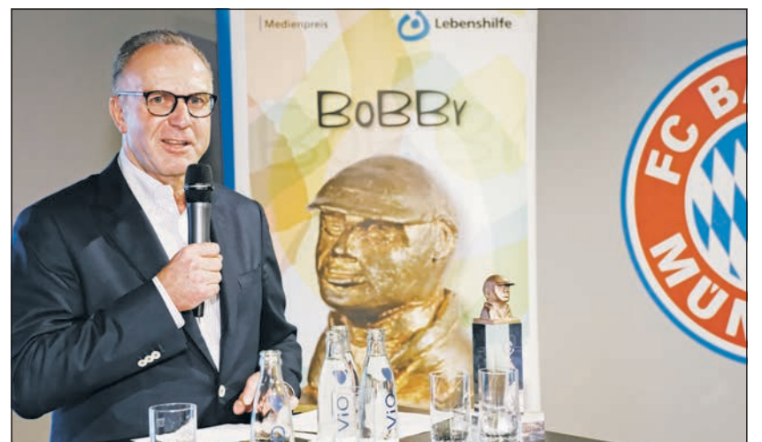
Karl-Heinz Rummenigge bei der BOBBY-Verleihung

... an einen jungen Mann mit Behinderung, der auf den Rollstuhl angewiesen ist. Ich kenne ihn jetzt schon einige Jahre, wir treffen uns immer wieder, und so unterschiedlich unsere Leben sind – in der Leidenschaft für den Fuß-