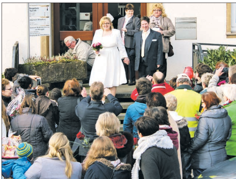
Freunde und Verwandte freuten sich mit dem Hochzeitspaar.