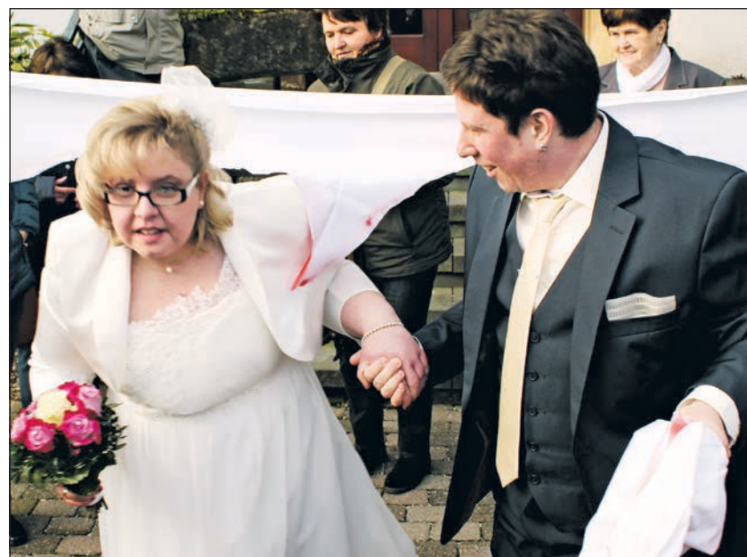
Händchenhaltend gelang der Sprung durch das Herz.