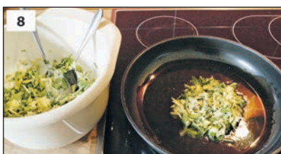
2 EL von der Kartoffelmasse in die Pfanne geben, etwas andrücken.

Aus: Kochwerkstatt des Familienunterstützenden Dienstes der Lebenshilfe Heinsberg in Leichter Sprache