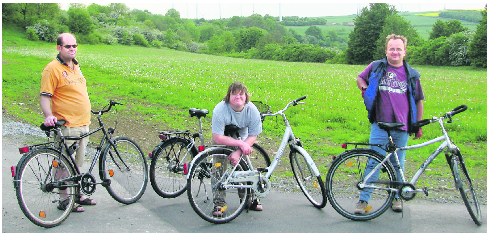
Ein gemeinsamer Ausflug mit dem Fahrrad verbindet.

Neue Freizeitstrukturen innerhalb einer Wohnstätte / Wochenende individuell gestalten