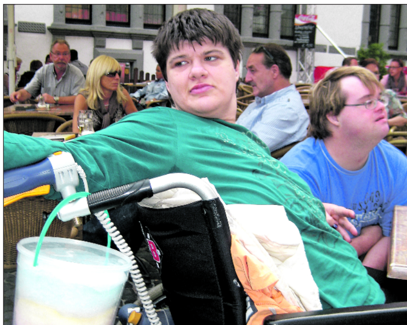
Miteinander in der Innenstadt von Paderborn.

Durch das gruppenübergreifende Arbeiten wird das „Wir-Gefühl“ innerhalb der Wohnstätte gestärkt. Die Bewohner der einzelnen Gruppen lernen sich untereinander besser kennen und die Atmosphäre wird offener.