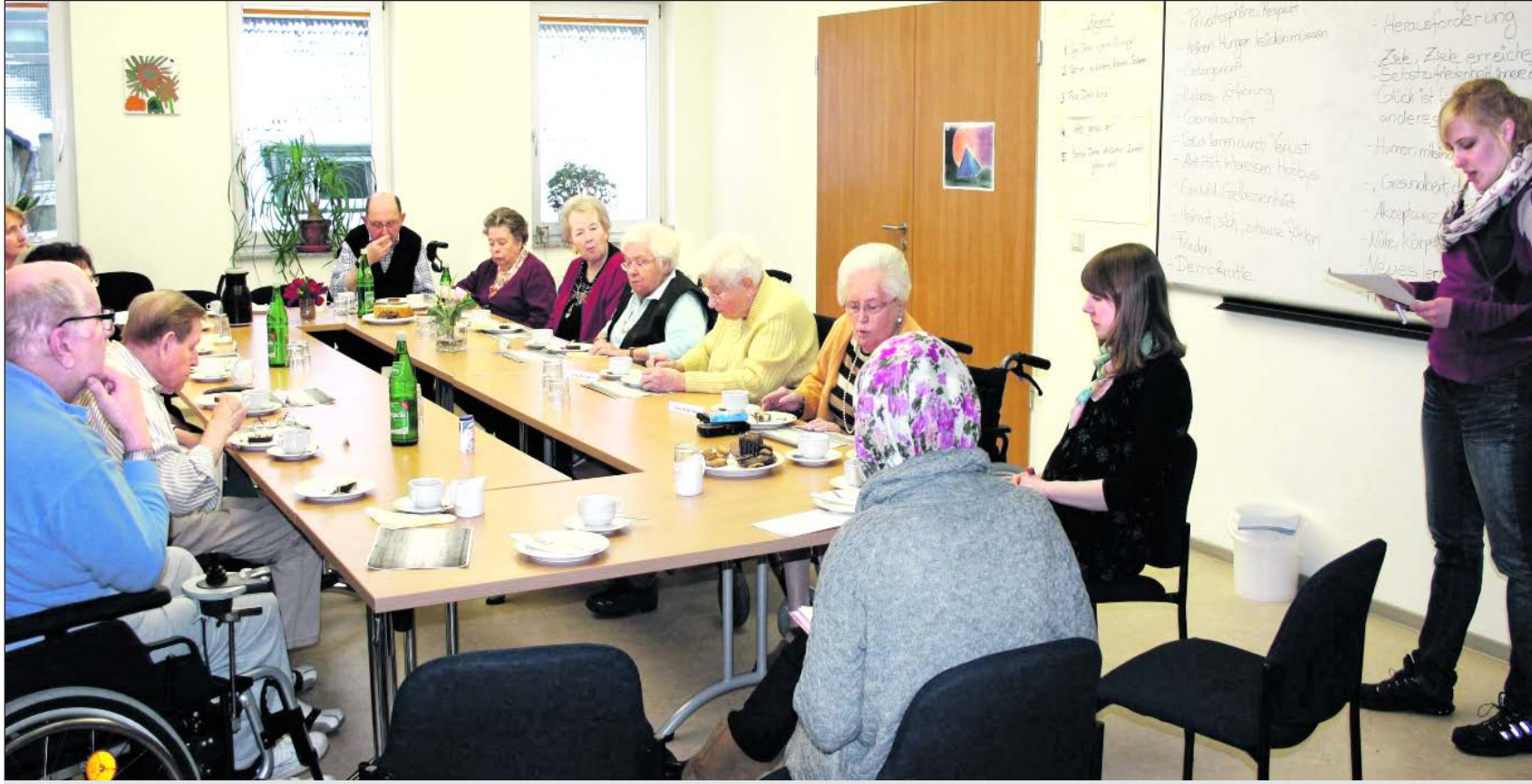
Gemeinsam philosophieren im Seniorenzentrum St. Martin in Essen.

Uni aktiv – Service Learning im Bereich soziale Arbeit bringt Studierende der Uni Duisburg-Essen und Senioren zusammen