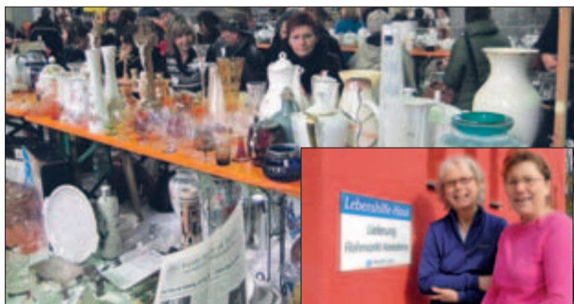
Trubel auf dem Flohmarkt in Aachen.

Voraussetzung für alle drei Dienste ist das Interesse am Einsatzgebiet im sozialen Bereich und der Begleitung und Unterstützung von Menschen mit Behinderung. Im Gegenzug erhalten die Engagierten eine Vergütung sowie eine gute praktische und theoretische Qualifizierung und Begleitung durch Fachkräfte – und zahlreiche positive Erfahrungen und persönliche Entwicklungen. Weitere Infos unter www.mein-lebenshilfe-jahr.de