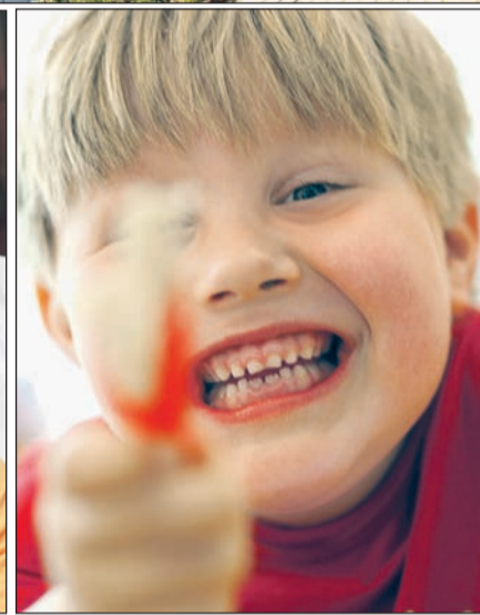
Eindrücke aus der Lebenshilfe Aachen.