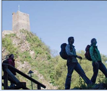
Wanderer auf dem Eifelsteig vor dem Kloster Himmerod in Manderscheid.