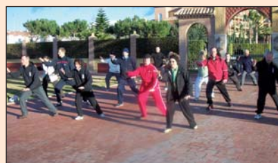
Schüler des Tai Chi Forums beim Ferienkurs an der Torrox Costa in Andalusien/Spainien.

Langsam geht eine Bewegung in die nächste über. Konzentriert werden die Übungen beim Tai-Chi-Chuan, einer jahrhundertealten, chinesischen Bewegungstechnik mit meditativer Ausrichtung, ausgeführt. Im Tai-Chi-Chuan als Entspannungstraining kommt es auf Weichheit und Geschmeidigkeit an. Die Muskulatur soll im Laufe der Zeit entspannt und die Gelen-