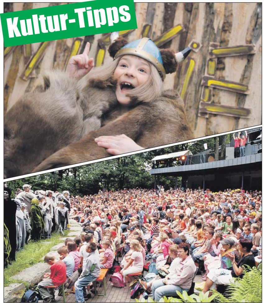
Abwechslungsreiches Programm wird auf der Waldbühne Heessen in Hamm und auf der Freilichtbühne Schloß Neuhaus geboten.