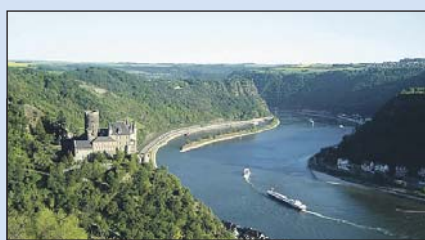
Tolle Aussicht auf die Burg Katz und die Loreley.

Natur ist Trumpf entlang des Rheinsteigs, an den Höhen von Siebengebirge, Westerwald und Tau-