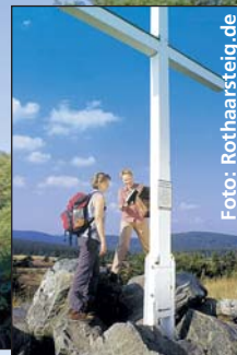
Wanderer auf dem Rothaarsteig.

nus ebenso wie an den steilen Talhängen des Rheintals. Beliebter Einstieg bei Wanderern: im Rheingau, denn hier verläuft der Weg nicht durch Schluchten, sondern über sanfte Hügel und Rebhänge mit tollem Panoramablick ins Rheintal.