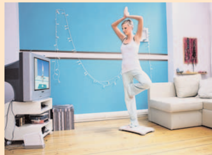
Sport vor dem Fernseher – Wii Fit sind Sie wirklich?

ditionellen Yoga-Posen, Muskelübungen mit Übungen zur Anspannung und Entspannung der Muskeln, Balancespiele zum Trainieren des Gleichgewichtssinns und Aerobic mit Übungen zu Fettverbrennung und zum Trainieren der Ausdauer. So müssen Spieler beispielsweise einen virtuellen Hula-Hopp-Reifen um die Hüften kreisen lassen, Fußball köpfen oder beim Tanztraining glänzen. Wii Fit ist nicht nur etwas für den Einzelnen, sondern auch für die gesamte Familie und fördert so die Kommunikation. So können sich Familienmitglieder beispielsweise beim Tennisspielen miteinander messen. (wv)