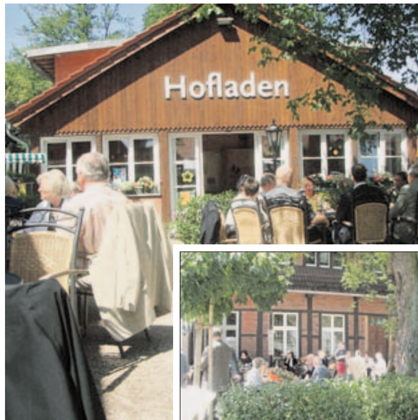
Kaffee und Kuchen im historischen Gutshaus „Café Gut Kinderhaus“.