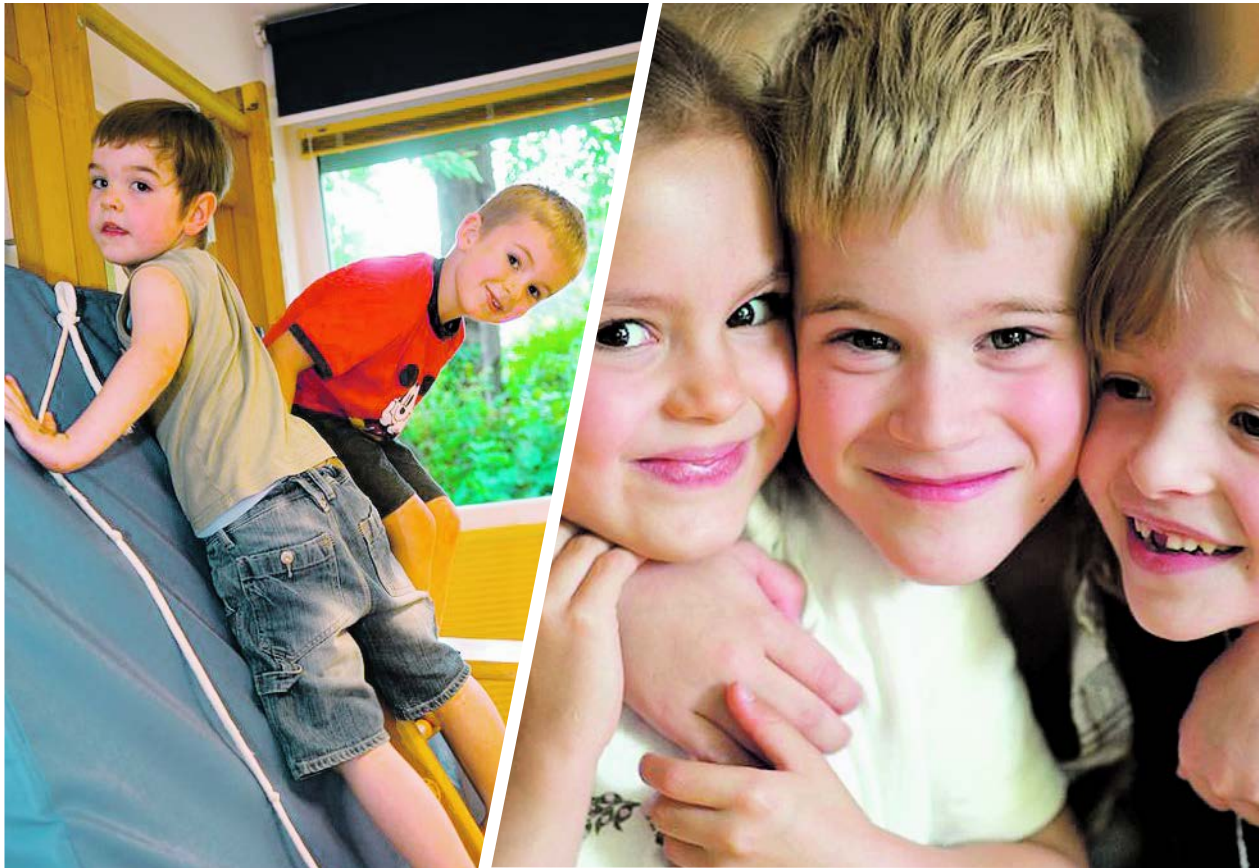
Kinder haben Spaß in Aachens Kindergärten.