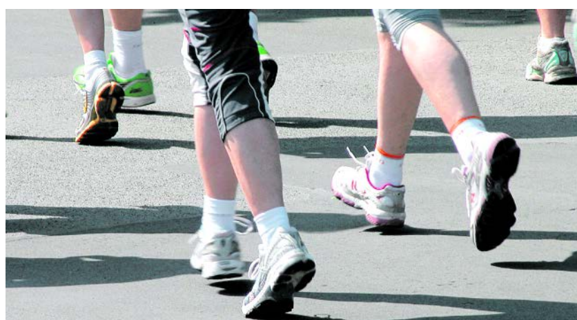
Sport tut gut – gerade nach der trüben und kalten Winterzeit.

Rein in die Laufschuhe – tun Sie Ihrem Körper etwas Gutes mit Bewegung in freier Natur und gesunder Ernährung. Besonders beliebt sind Joggen, Nordic Walking, Radfahren, Wandern und Schwimmen. Der Körper wird durch Bewegung leistungsfähiger – gerade Laufen