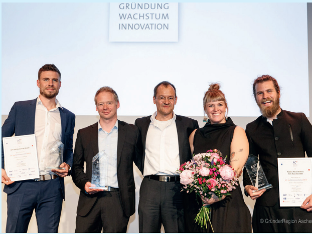
Die Gewinner 2019 im Krönungssaal des Rathauses Aachen