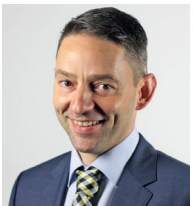
Thomas Roth Gözl GmbH