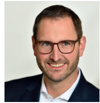
Christoph Werner ID Ingenieure und Dienst- leistungen Gesellschaft mit beschränkter Haftung