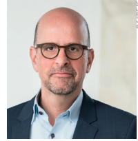
Bernhard Kugel S-UBG Aktiengesellschaft Unter- nehmensbeteiligungsgesellschaft für die Regionen Aachen, Krefeld und Mönchengladbach