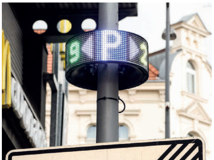
Macht Autofahrern die Richtungsentscheidung leicht: das neue Parkleitsystem von RheinEnergie und Cleverciti in Köln-Nippes.

installiert. Die runden Displays fügen sich dabei perfekt in das Straßenbild ein. Der kostenlose Service erfasst zurzeit rund 800 Stellplätze. Die mit künstlicher Intelligenz (KI) ausgestatteten Sensoren liefern präzise Daten zur Parkplatzverfügbarkeit. Diese werden den Verkehrsteilnehmern dann in Echtzeit lokal auf den LED-Displays angezeigt, sodass die Suche in bereits