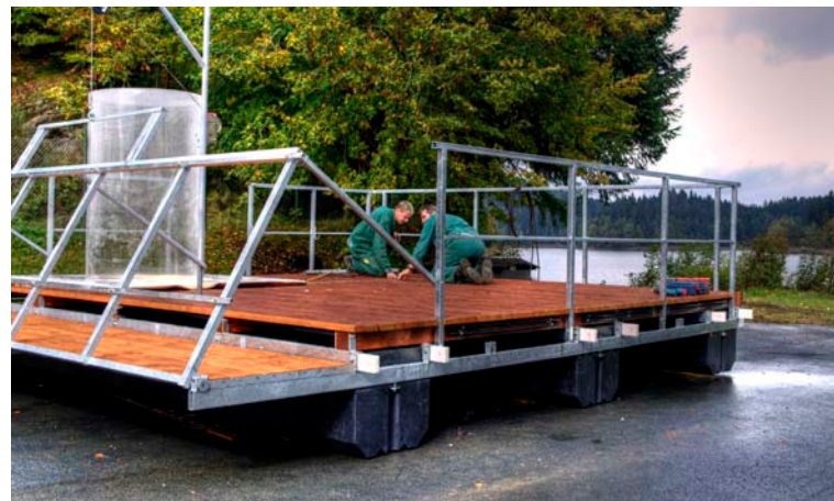
Mitarbeiter bei einem Talsperreneinsatz