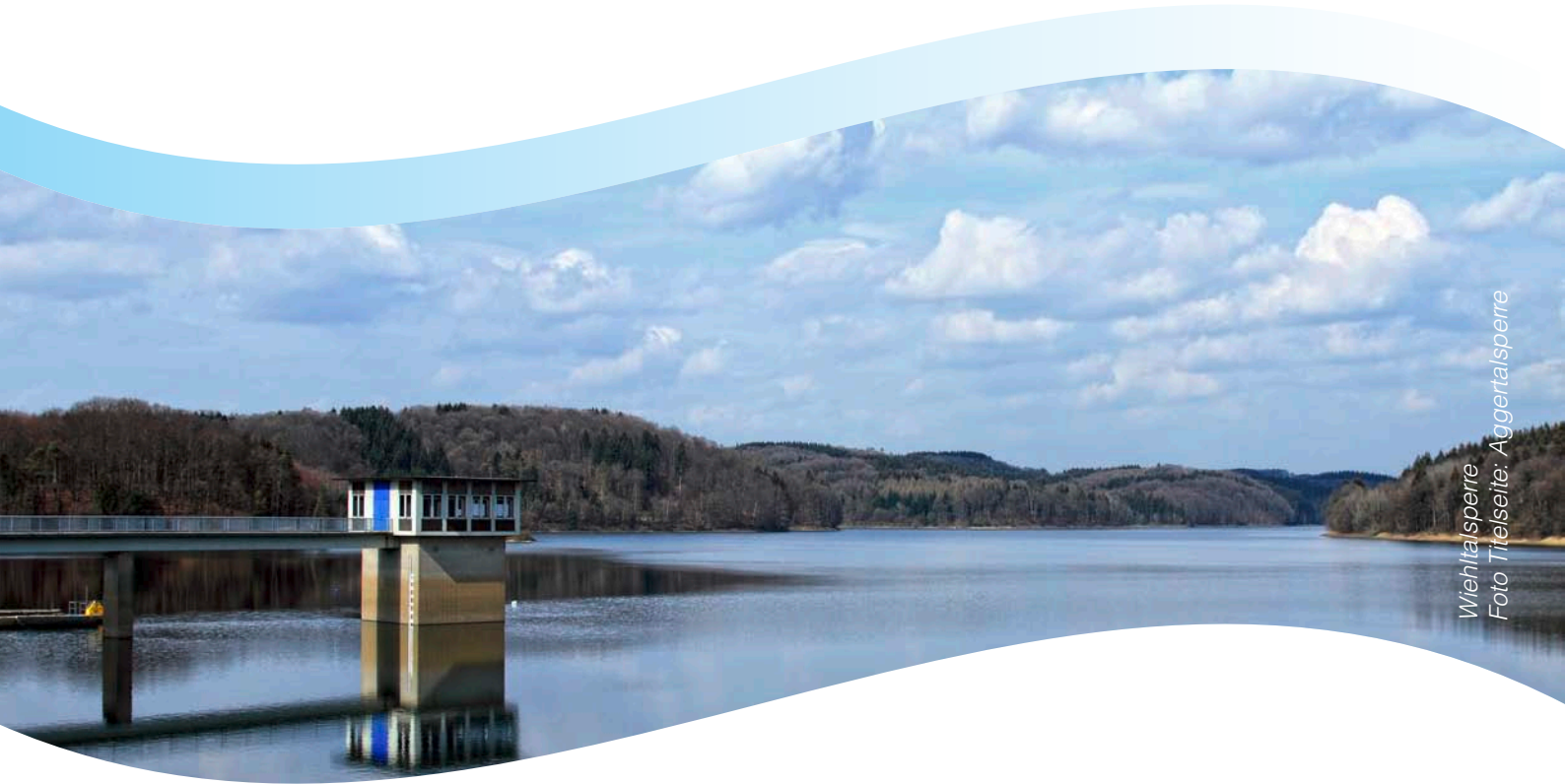
Wiehltalsperre Foto Titelseite: Aggertalsperre

Aggerverband Körperschaft des öffentlichen Rechts Sonnenstraße 40 51645 Gummersbach