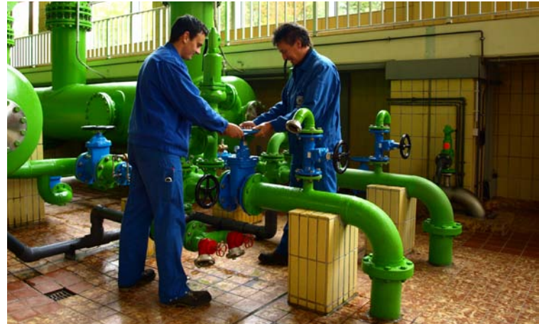
Alltag im Wasserwerk Aichel

Geht es um Untersuchungen der Qualität von Wasser und Gewässern, sind wir ein verlässlicher Ansprechpartner und Dienstleister. Wir beraten und informieren, was beim Grundnahrungsmittel Trinkwasser höchste Güte ausmacht und stellen wichtige Betriebsdaten für die Abwasserreinigung bereit. Gleichermäßen profitieren Dritte von unseren Laborergebnissen, wenn wir konkrete Daten als Dienstleister ermitteln. So sorgen wir direkt für beste Wasserqualität.