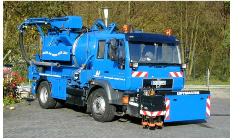
Fahrzeug für die Sinkkastenreinigung

Wir setzen uns für Mensch und Umwelt ein – damit auch künftige Generationen von einer lebens- und lebenswerten Umwelt profitieren.