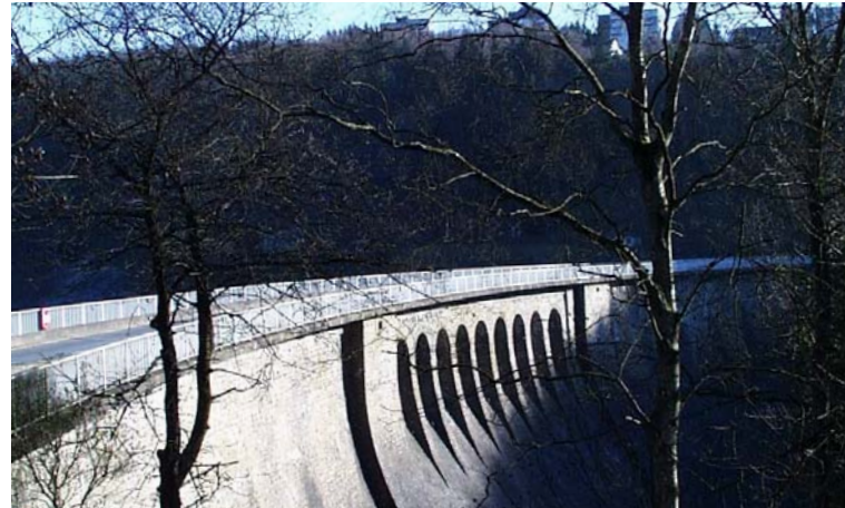
Sperrmauer der Aggertalsperre

Bei der Aufgabenerfüllung verstehen wir uns als Dienstleister und orientieren uns am Bürger. Wir setzen unsere ganze Kompetenz und Flexibilität ein. Wir übernehmen die Verantwortung für unser Handeln, nach innen und außen. Auch das stärkt uns als verlässlichen Partner in Wasserfragen.