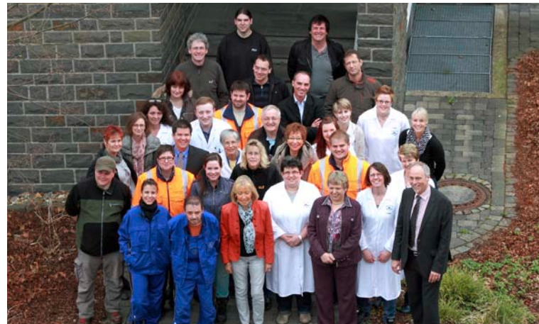
Mitarbeiterinnen und Mitarbeiter des Aggerverbandes