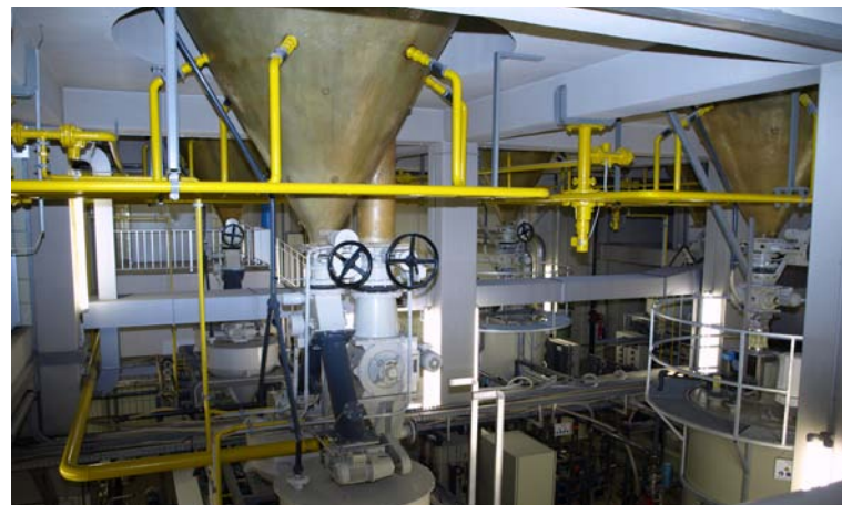
Hochmoderne Technik im Wasserwerk