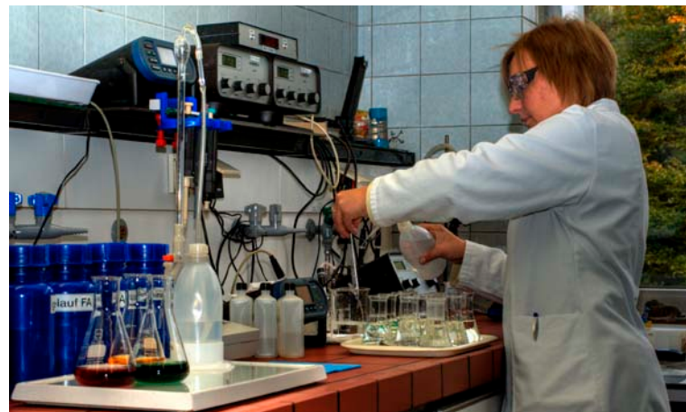
Präzision – ein Qualitätskriterium