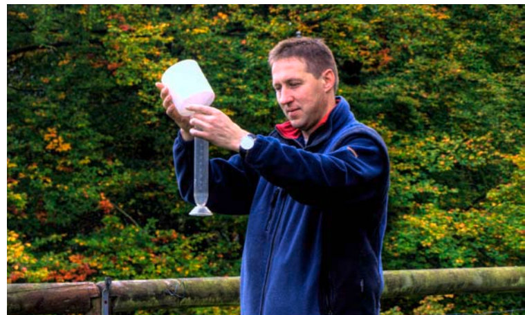
Messungen – unser tägliches Geschäft