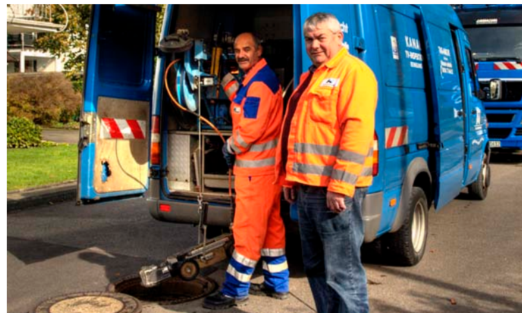
Zuverlässiger Einsatz vor Ort