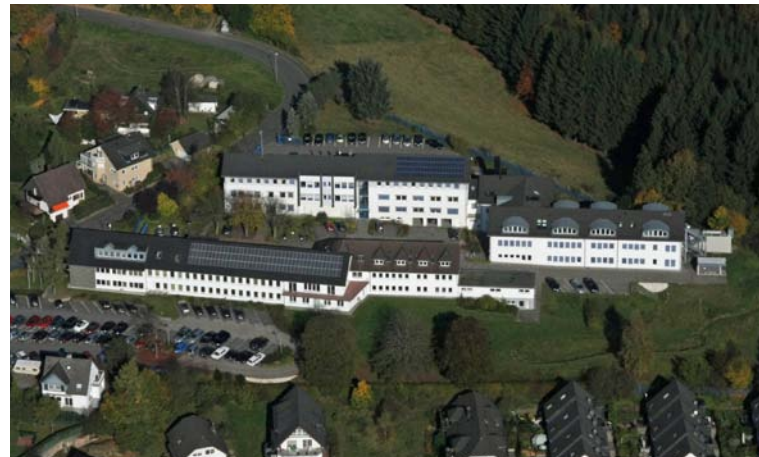
Verwaltungsgebäude des Aggerverbandes