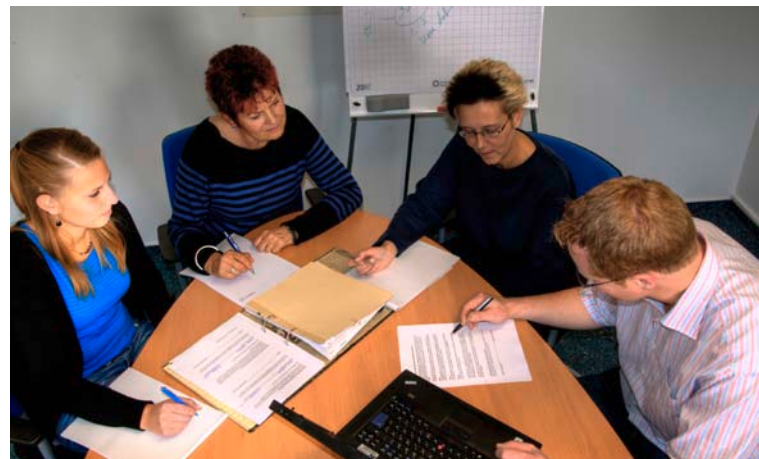
Der Aggerverband – ein starkes Team

Den demokratischen Grundwerten sind wir in besonderem Maße verpflichtet – so empfindet es jede Einzelne und jeder Einzelne in unserem Unternehmen, unabhängig von der individuellen Aufgabe. Freie Meinungsäußerung , Gleichberechtigung und Gerechtigkeit sind für uns keine Worthülsen, sondern Aspekte eines fairen und offenen Umgangs miteinander. Offene Kommunikation wird bei uns groß geschrieben!