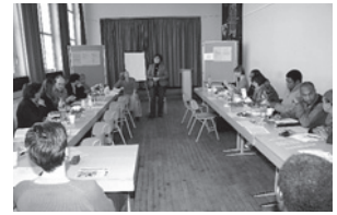
Afrikanische Regionalkonferenz Eine Welt Forum

An der Schanz 1 52064 Aachen Tel.: 0241/894495-60 1wf@1wf.de www.1wf.de Unter dieser Adresse erhält man auch alle wichtigen Informationen zu den „Afrikanischen Regionalkonferenzen“