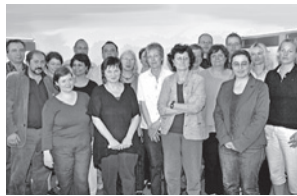
Das Team der Kommunalen Agentur für Bildungserstberatung

Die kostenfreien Beratungsleistungen werden durch ein „Migrantenticket“ unterstützt, das auf die Beratungsangebote vor Ort verweist und aufeinander aufbauende Beratungen gewährleistet.