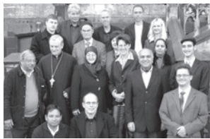
Die Mitglieder des „Dialogs der Religionen“

Aachen beheimatet viele unterschiedlichen Religionen und Gemeinden mit einer großen konfessionellen Vielfalt. Der „Dialog der Religionen“ ist ein Arbeitskreis von Vertreter/innen der Religionsgemeinschaften, die nach gemeinsamen Handlungsfeldern suchen, um miteinander das Zusammenleben von Menschen unterschiedlicher Religionen und Kulturen in Aachen zu fördern.