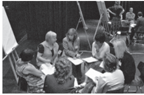
Workshop Ludwig Forum „Migranten- und Studentenorganisationen stärken, qualifizieren, vernetzen“

Die Vernetzung öffentlicher und privater Initiativen auf kommunaler Ebene ist unverzichtbare Voraussetzung für eine erfolgreiche Integrationsarbeit. Deshalb haben sich Ämter der Stadt Aachen, freie Träger und Vereine über ihre Arbeitsschwerpunkte hinausgehend zu einem Netzwerk zusammengeschlossen, um die Aktivitäten im Bereich der Migrationsarbeit aufeinander abzustimmen.