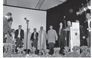
Multireligiöse Friedensfeier des „Dialogs der Religionen“ zum „Tag der Integration 2007“

Liebigstr. 10 52070 Aachen Tel.: 0241/501444 buero@vineyard-aachen.de www.vineyard-aachen.de