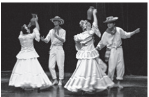
Herencia Latina – Lateinamerikanischer Tanz

Couvenstr. 15, 52058 Aachen Tel.: 0241/4791-0, bibliothek@mail.aachen.de Öffnungszeiten: Di, Mi, Fr: 11.00–18.00 Uhr Do: 13.00–19.00 Uhr, Sa: 10.00–13.00 Uhr