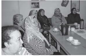
Seniorengruppe, Werkstatt der Kulturen

In Aachen gibt es eine Reihe von Einrichtungen, die zu allgemeinen Fragen des Älterwerdens oder zu speziellen Problemen Informationen und Hilfestellungen geben.