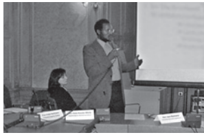
Veranstaltung „Erfolgreiches Vereinsleben“