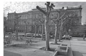
Hauptgebäude der RWTH Aachen

Pontstr. 74-76, 52062 Aachen, Tel.: 0241/4700-123 info@khg-aachen.de www.khg-aachen.de