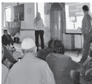
Veranstaltung zu Integrationsangeboten der Stadt in der Yunus-Emre-Moschee

Der Dialog hat viele Formen: Gespräche im Alltag, Begegnungen in der Arbeit und der Nachbarschaft, Konferenzen von Religionsführer/-innen, Führungen in den eigenen Sakralbauten, gemeinsame soziale Projekte und die Mitarbeit in interreligiösen Organisationen.