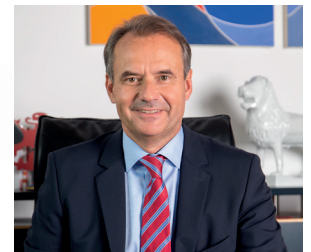
Ulrich Markurth Oberbürgermeister

Ich wünsche der Broschüre viele Nutzerinnen und Nutzer und der Stadt zahlreiche weitere Anregungen für unseren gemeinsamen Weg „Barrierefrei durch Braunschweig“.