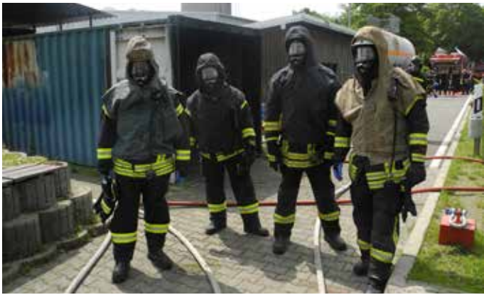
Ein Trupp startklar für den Flashover-Container

Dieses Training bestand aus zwei aufeinander aufbauenden Modulen: Der erste Schritt ist das Training des richtigen feuerwehrtaktischen Verhaltens beim Löscheinsatz eines Kellerbrandes (mit Gasflaschen-Attrappen), eines Küchenbrandes und eines Wohnungsbrandes (mit Flash-Over-Effekt). Dies geschah unter nahezu realistischen Bedingungen in der gasbetriebenen Feuerlöschübungsanlage.