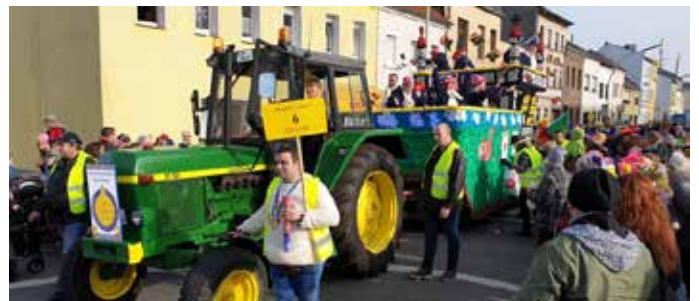
Prunkwagen der Rheindorfer Karnevalsfreunde e.V.

Die Rheindorfer Karnevals Freunde (RKF) möchten sich gerne einmal vorstellen. Gegründet haben wir unseren Verein 2017, aus einer Gruppe lustiger Leute, die sich dem Karneval verschrieben haben. Wir treffen uns einmal im Monat zum Gedankenaustausch und zum gemütlichen Beisammensein. Unsere Mitgliederzahl beträgt z. Zt. 28 Personen. Ob „Jung oder Alt“, jeder ist bei uns willkommen.