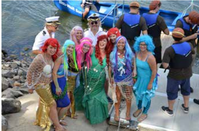
Die Gewinnerinnen des Preises für das schönste Kostüm beim Elefantenrennen 2018: „Die charmanten Nachbarinnen“.

Nach dem Stiftungsfest ist vor dem Stiftungsfest und deshalb ist es bald wieder soweit: Der Blau-Weiß lädt für Sonntag, 25. August 2019, zum 89. Stiftungsfest samt legendärem Elefantenrennen ein. Das Fest selbst mit Kaffee, Kuchen, Waffeln, Gegrilltem, Kinderprogramm, Kanu-Demonstration und vielem mehr beginnt an diesem Tag um 12 Uhr.