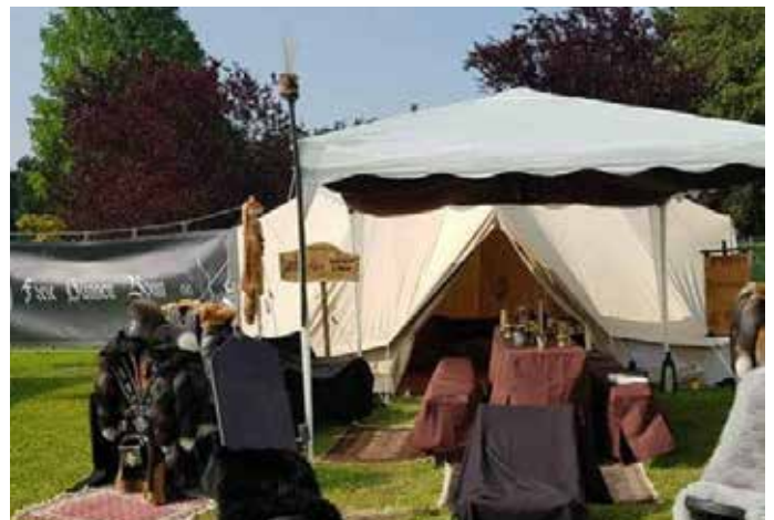
Die Jurte der Hunnen