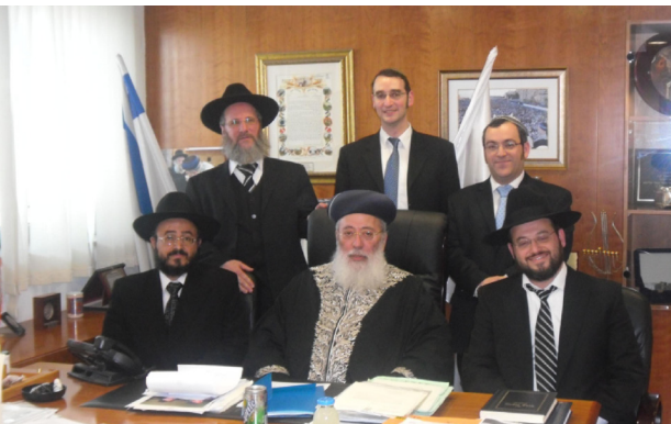
Im Büro des Oberrabbiners des Staates Israel Shlomo Moshe Amar, Januar '11

In diesem Rahmen wurden in den vergangenen sechs Jahren ca. rund 200 Fälle behandelt. Der Bet Din hat dabei etwa 35 Gitin (religiöse Scheidungen) und 60 Gijurim (Übertritte zum Judentum) durchgeführt und bei vielen Anträgen und komplizierten Anfragen Entscheidungen herbeigeführt. Insbesondere im vergangenen Jahr kann die ORD auf aktive und fruchtbare Tätigkeit des Bet Din zurückblicken. Die Kombination von halachischer Kompetenz, menschliches Feingefühl und Effizienz lässt uns optimistisch in die Zukunft blicken und darauf hoffen, dass der Bet Din auch weiterhin an der Bildung und Stärkung jüdischen Lebens in Deutschland und der damit verbundenen G-ttlichen Inspiration seinen Anteil tragen möge.