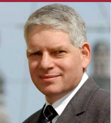
von Dr. Josef Schuster