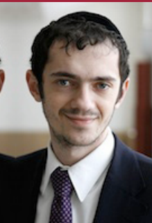
Раввин Авраам Итцхак Радбиль

10 дней раскаяния, то есть время между Рош Ашана и Йом Киппуром отличается тем, что во многих еврейских общинах по всему миру царит атмосфера особенной набожности и богобоязненности, поскольку это последний период времени, когда еще можно изменить небесный приговор, вынесенный в Рош Ашана.