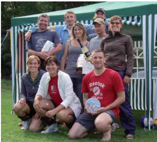
Die Sieger 2010.