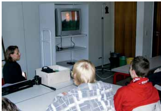
Begutachtung eines aufgezeichneten Bewerbungsgesprächs