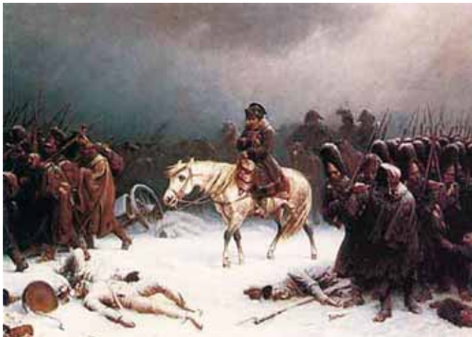
Napoleon auf dem Rückzug

krönen. Das nämlich war sein eigentliches Ziel: „In fünf Jahren bin ich der Herrscher der Welt“ hatte er gesagt! Mit 600.000 Soldaten aus 20 Ländern – darunter die wenigsten Franzosen – wagte er dieses Abenteuer. Am 14. September 1812 zieht er kampflos in Moskau ein. In der Stadt bricht aus ungeklärten Gründen Feuer aus. Da dadurch auch die Versorgung gefährdet ist, beginnt Napoleon mit der Grande Armée fluchtartig den Rückzug aus Russland. Hunger, Kälte und Krankheiten begleiten das fliehende Heer auf dem Rückmarsch.