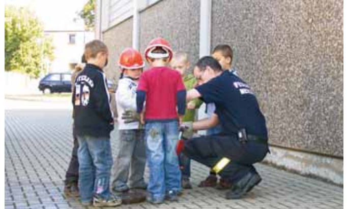
Wo bekommt die Feuerwehr das Löschwasser her?

Wir stellen Bilder von den Besuchen der einzelnen Gruppen auf unserer Seite im Internet zur Verfügung. Sie finden diese auf http://www.feuerwehr-merzenich.eu unter „Bildgalerie“.