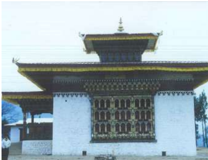
Der Yangner Lakhang

Oktober 13 000 Bhutaner hören die Belehrungen von Dungse Rinpoche in Rangjung