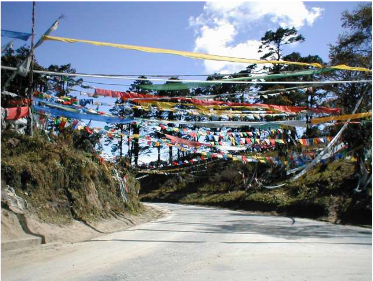
Dochula (aufgenommen im Jahre 2000)