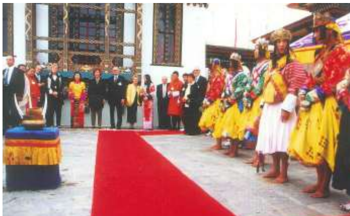
S.M. Königin Ashi Dorji Wangmo Wangchuck, mit Botschafterin Brigit Breuel, Ministerin Heidemarie Wieczorek-Zeul und vielen Gästen während der Zeremonie anlässlich des Bhutantages auf der EXPO 2000