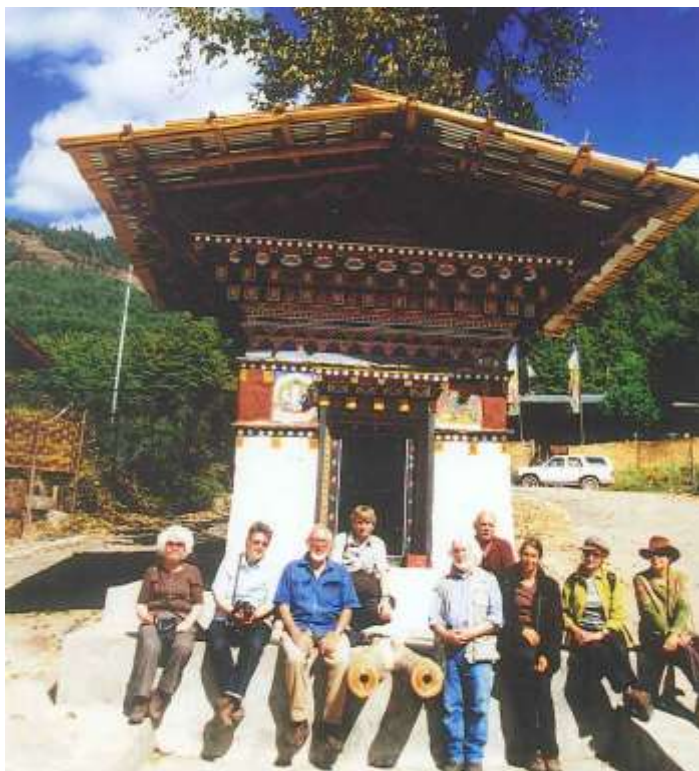
Eine Delegation der DBHG besucht den renovierten Tamshing Mani Choskor ; das Wasser treibt nun wieder die Gebetsmühle an