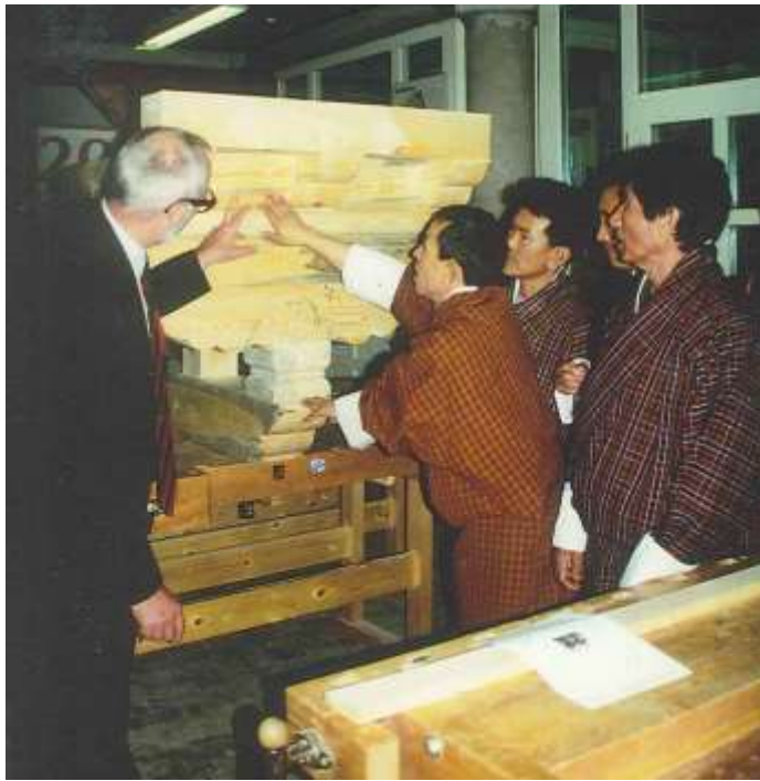
Expertenaustausch mit Prof. Gerner: Sieben bhutanische Fachleute bilden sich im Jahre 2000 für 3 Wochen am Deutschen Zentrum für Handwerk und Denkmalpflege in Fulda fort