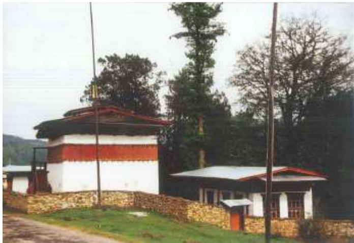
Der Chuckchi Lhakhang in Bumthang