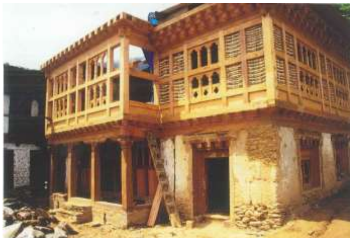
Neu errichtetes oberes Stockwerk des Bjee Samten Choling Lhakhang bei Trongsa