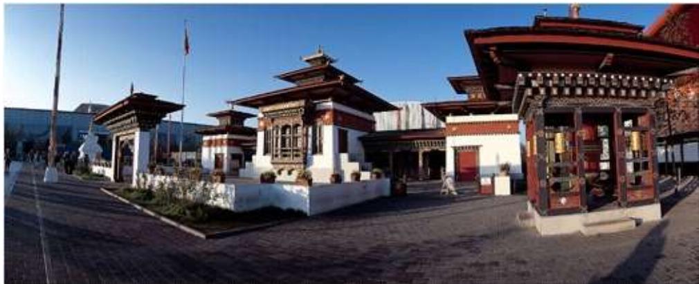
Der Bhutanpavillon auf der EXPO 2000 in Hannover