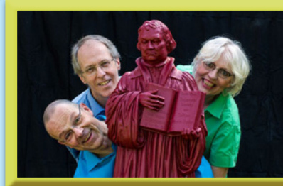
Klügelbeutel: „Djihad in Wittenberg“ SO | 11.02. | 19.30 Uhr