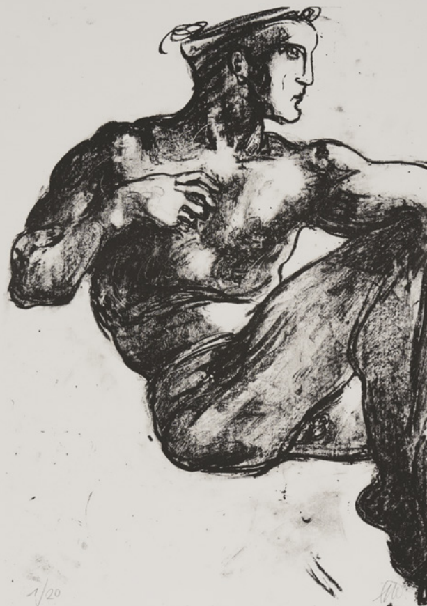
Abbildung: Markus Lüpertz, Michael Engel, Lithografie 2017, 82,8 x 61,5 cm © Markus Lüpertz, Galerie Breckner. VG Bild-Kunst, Bonn 2018

SO | 21.01. bis SO | 04.03.2018 „MICHAEL ENGEL“ im STADTMUSEUM im Kulturhaus