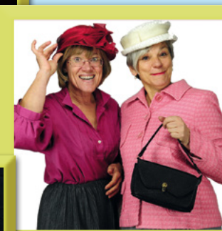
FKK-Frauen-Kabarett-Krefeld: „Zwei bessere Hälften“ SO | 11.02. | 15.30 Uhr