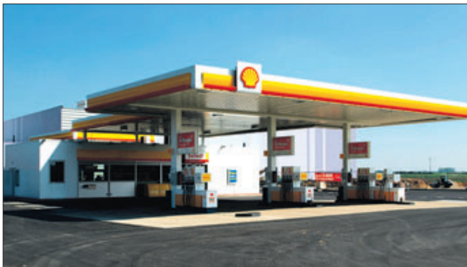
Am 13. Mai wird die neue Shell-Tankstelle in Weilerswist (Parkallee 3) eröffnet. Der »Stargast« hat übrigens vier Räder - ein Ferrari F2007.

Fans, die einen solchen Boliden mal hautnah erleben möchten, sollten also vorbeikommen. Und während Papa dem Rennwagen un-