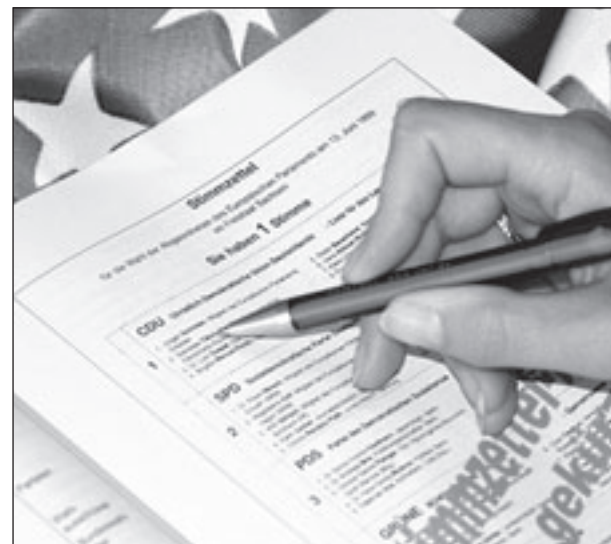
Am Sonntag, 7. Juni, sind die Bürger in den Mitgliedsstaaten der Europäischen Union zur 7. Wahl des Europa-Parlaments aufgerufen.

Es ist das Anliegen aller deutschen Parteien, die repräsentative demokratische Leitung und Kontrolle der Europäischen Union nicht mehr nur über die nationalen Parlamente, sondern auch über das gemeinsame Europäische Parlament zu stärken. Sie, liebe Mitbürgerinnen und Mitbürger können dazu beitragen, das