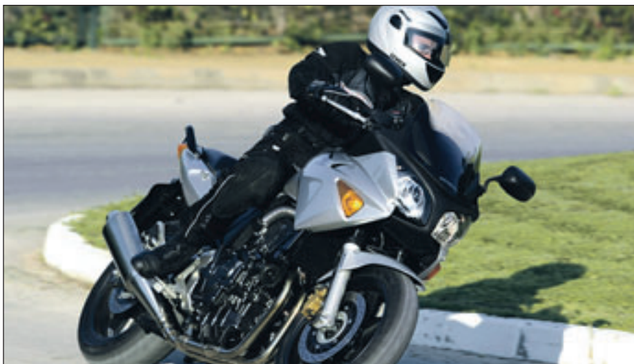
Die Motorrad-Trainings haben Mitte März begonnen. In kurzweiligen, praxisnahen Trainings werden Wiedereinsteiger und Routiniers fit für die Saison gemacht.

Viel Geld gibt es für viele Unternehmen, die mit ihren Mitarbeitern ein Fahrsicherheitstraining ab-