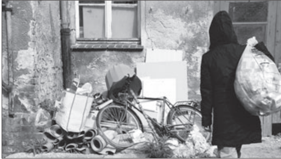
Kein schöner Anblick: Wild abgelagerte Problemabfälle.

Bei den Sondermüllabfällen handelt es sich um schadstoffhaltige Abfälle, die nur in den Originalver-