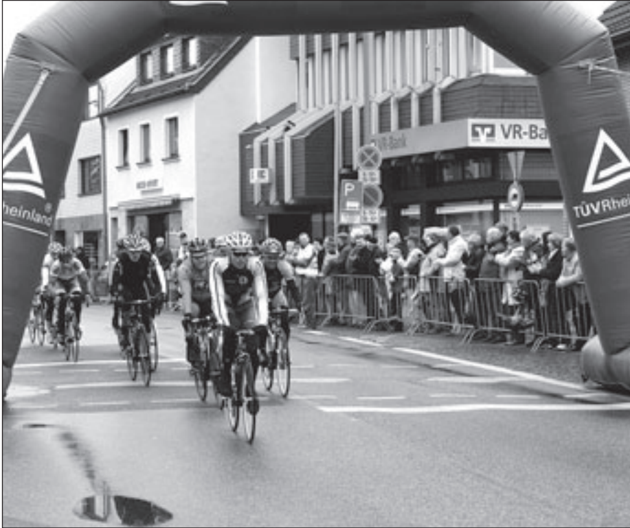
Die Sprintwertung in der Kölner Straße in Weilerswist zog zahlreiche Zuschauer an.