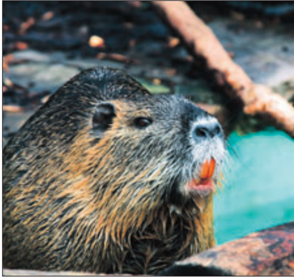
Die Biberratte ( Myocastor coypus ), auch Nutria oder seltener Sumpfbiber, Schweifbiber, Schweifratte, Coypu oder Wasserratte genannt, ist eine aus Südamerika stammende und in Mitteleuropa eingebürgerte Nagetierart.

Zu einer Abladestelle für Brot-, Gemüse- und Obstabfälle entwickelt sich inzwischen der kleine Weiher an der Erft neben der neuen Verbindungsstraße L 163 n.