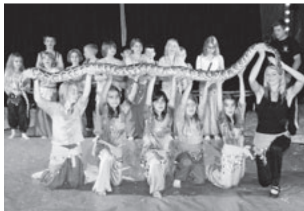
Keine Angst vor der Riesenschlange hatten die kleinen Artisten.

VERNICH. Zu Zirkusartisten wurden die Schülerinnen und Schüler der Grundschule Vernich im Juni. Mit dem Zirkus „Casselly“ aus Bad Honnef hatten die Kinder im Rahmen einer Projektwoche trainiert und zeigten ihre Talente in zwei völlig ausverkauften Vorstellungen.