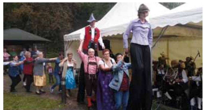
Text / Foto: RDB BG Hambach

Alles in allem: Das 1. Oktoberfest der Bezirksgruppe Hambach war ein voller Erfolg. Die Begeisterung aller Anwesenden war so groß, dass die Verantwortlichen der Vorbereitungsgruppe überlegen, eine solche Veranstaltung doch in das allgemeine Jahresprogramm aufzunehmen.