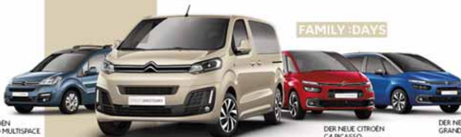
DER CITROËN BERLINGO MULTISPACE