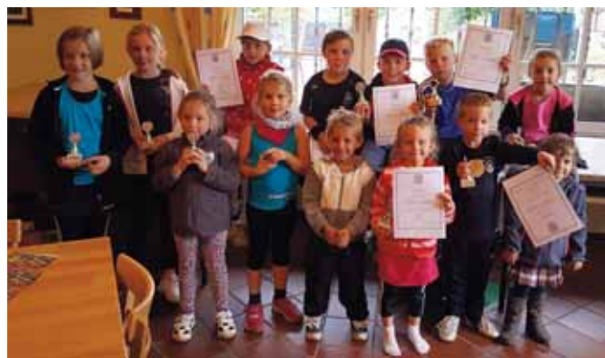
Die Teilnehmer des Mini- und Maxifeldturniers bei der Siegerehrung