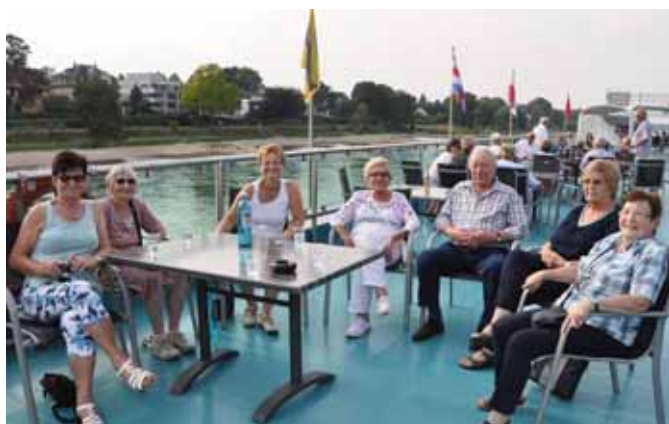
Entspannung und Gemütlichkeit auf dem Sonnendeck genossen diese Passagiere aus Krauthausen.