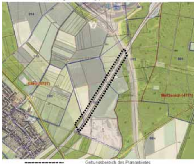
Lageplan zur 57. Aufstellung des Flächennutzungsplanes sowie Aufstellung des Bebauungsplanes D 07 – „Solarautobahn“

Neben der Begründung mit Umweltbericht gemäß § 2a BauGB stehen gemäß § 3 Abs. 2 BauGB die folgenden umweltbezogenen Informationen zur Verfügung: